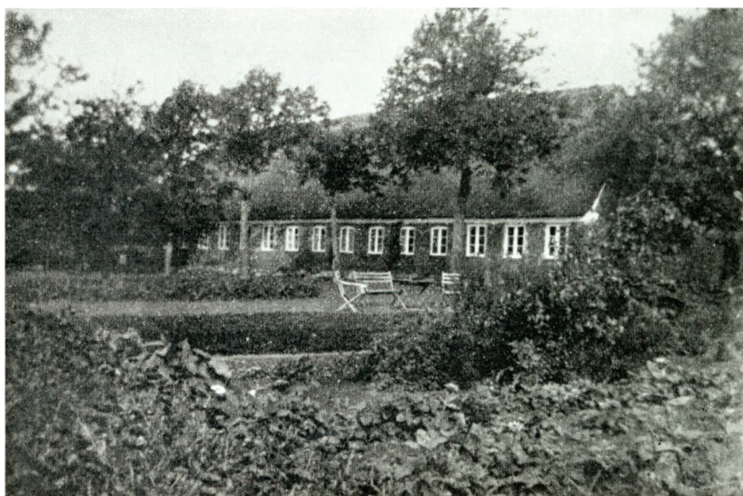
Annexgaarden i Aarre.