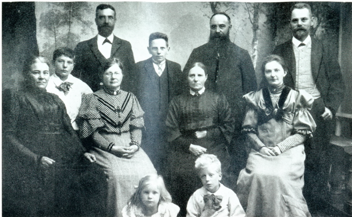
Famíliesammenkomst i Trustrup omkring 1905.