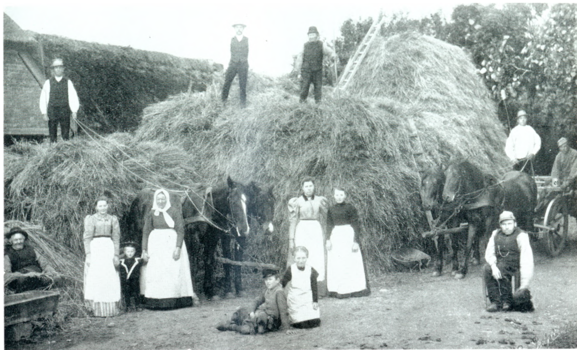
En Høstdag i Vinde Vestergaard i Slutningen af 90-erne.