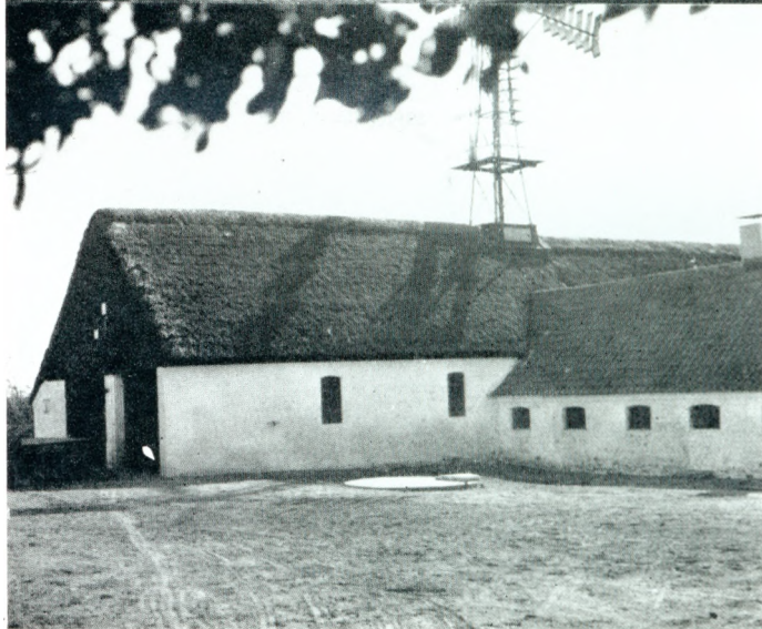
Fra Vinde Vestergaard af i Dag.