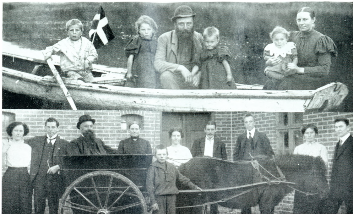
Fra Aa Mølle. Øverst i Slutningen af 90-erne. Nederst omkring 1920.