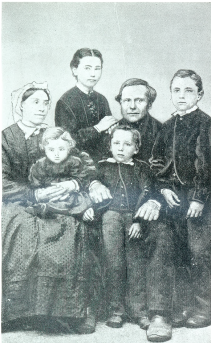
Familien i Vinde Vestergård i Begyndelsen af 70-erne.