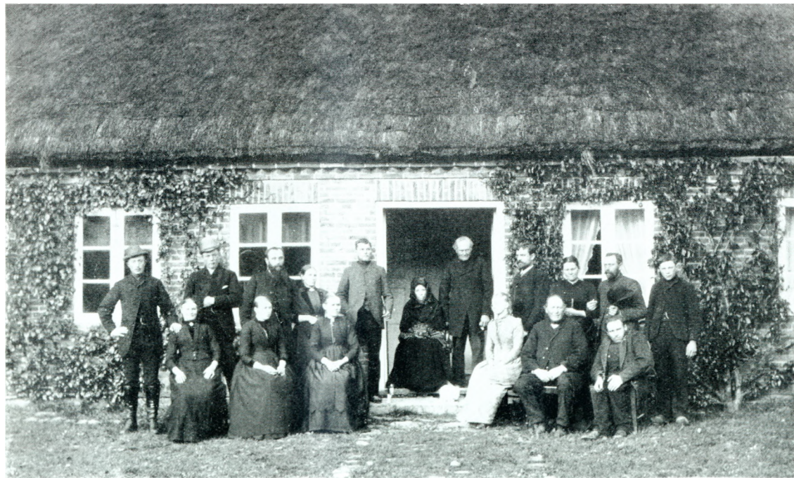
Famlesamlingen i Vindø Vestergård i Mølle, ca. 1900.