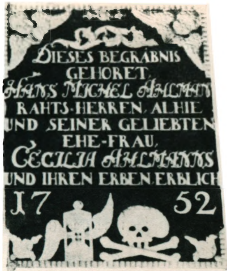
Epitafium i Marie-kyrkan i Sönderborg.