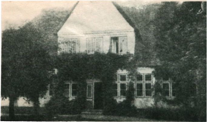
Prostgarden i Guderup (Egen).