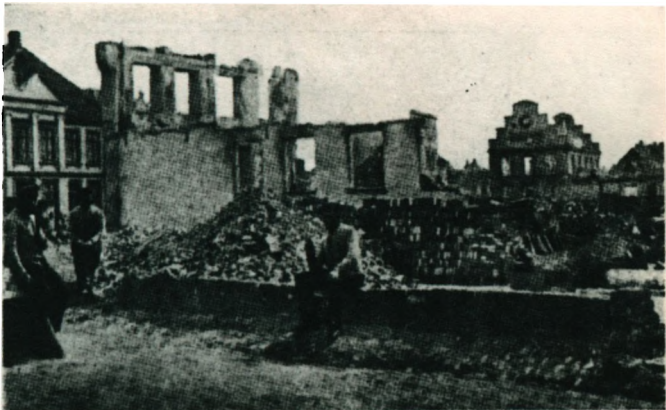
Rådhuset i Sönderborg efter bombardemang natten till den 3 april 1864.