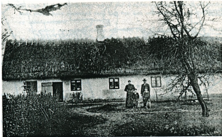
Stueløngen Kildebrøndevej 24 Nu nedrevet - foto 1910