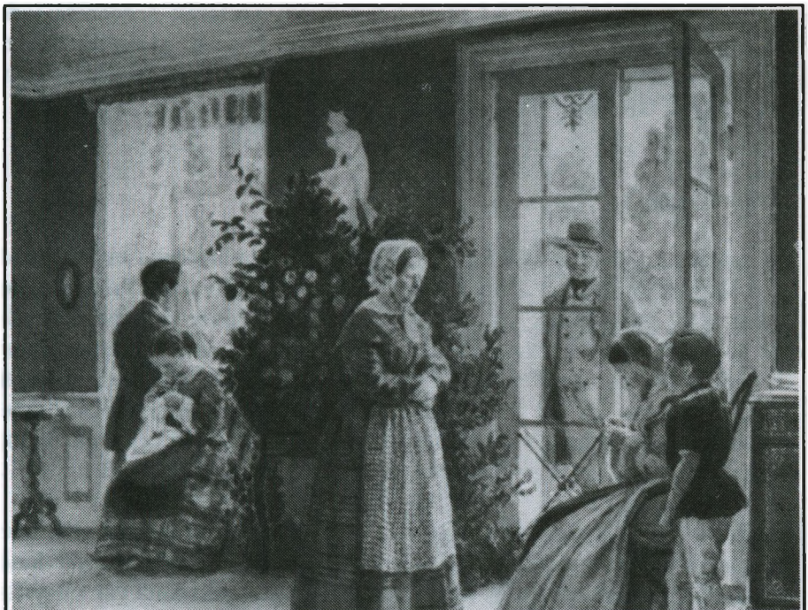
Familiehygge i havestuen

Interessen for landbruget var hende medfødt, efter sin opvækst på en mønstergård, med en sjælden fremskridtsmand til far". 7