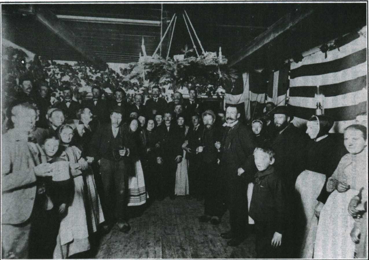
Gode fester og traditioner lokker folk til at blive