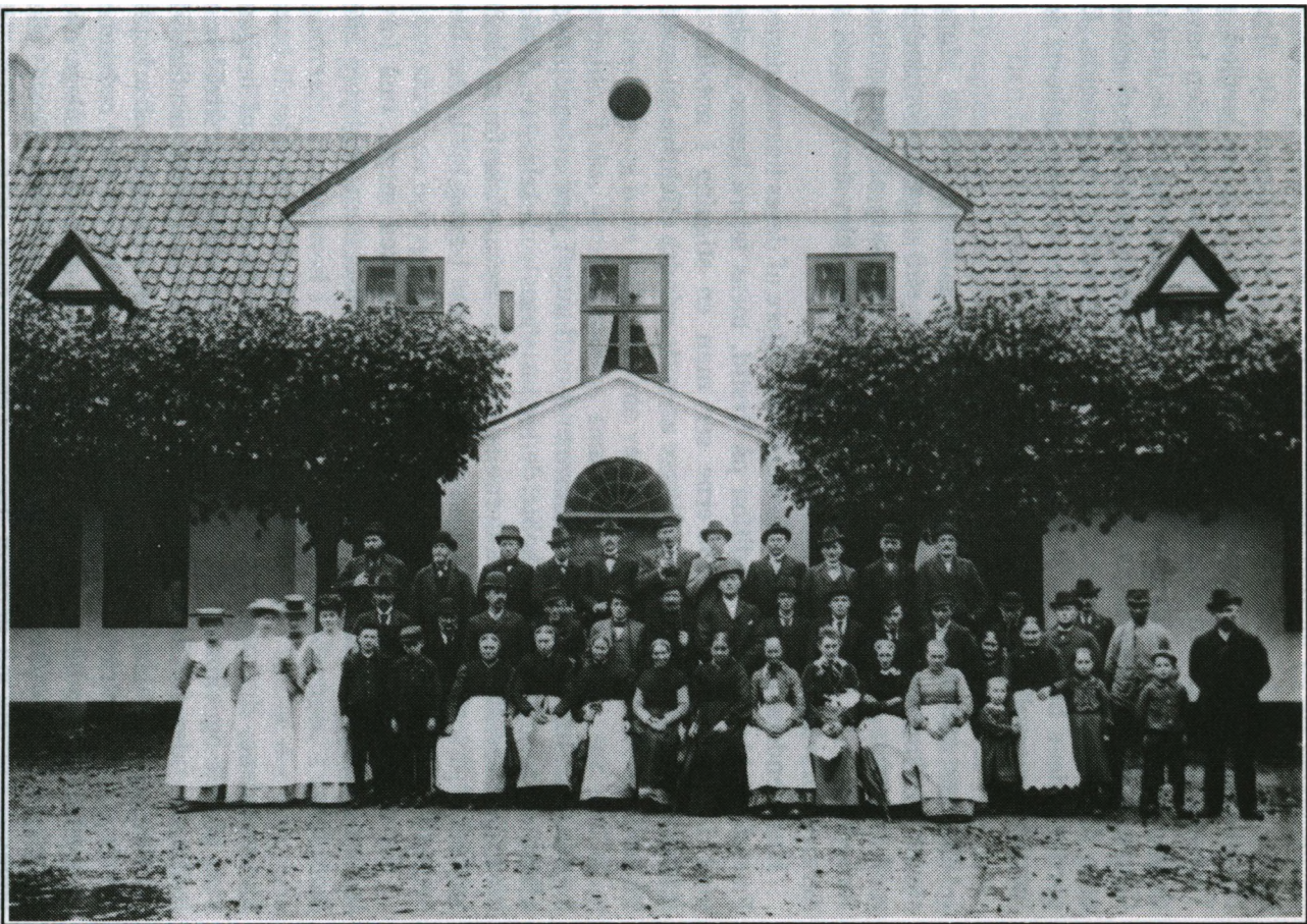
De ansatte på Geddesdal - mejerskene i hvidt