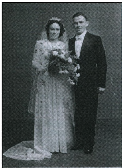
Vores bryllup i 1942.