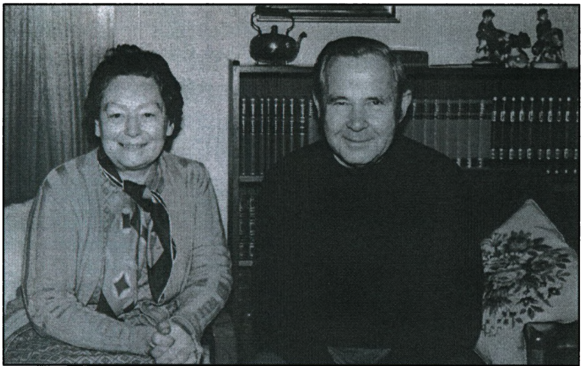
Fra min 70 års fødselsdag i 1984.

Det stiller store krav til institutionerne og personalet. Det gør et stærkt indtryk at komme tættere på den sociale sektor. Arbejdet i den undervisningskulturskabende sektor er forebyggende for det sociale, også det helbredende prioriteres højt.