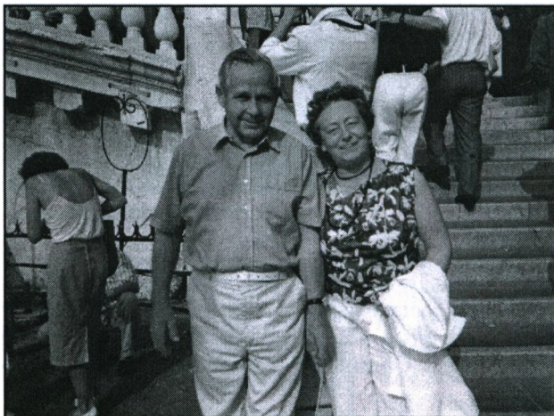
Fra et ferieophold i Venedig.

Jeg kunne – og ønskede – naturligvis ikke helt at opgive mine udadvendte aktiviteter, deltagelse og indflydelse på det mere lokale foreningsliv.