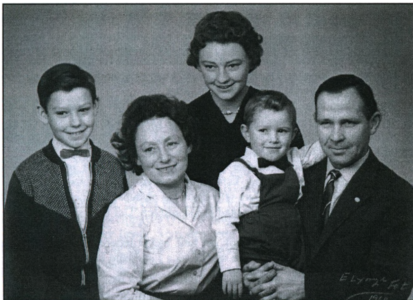
Familiefoto fra 1960.