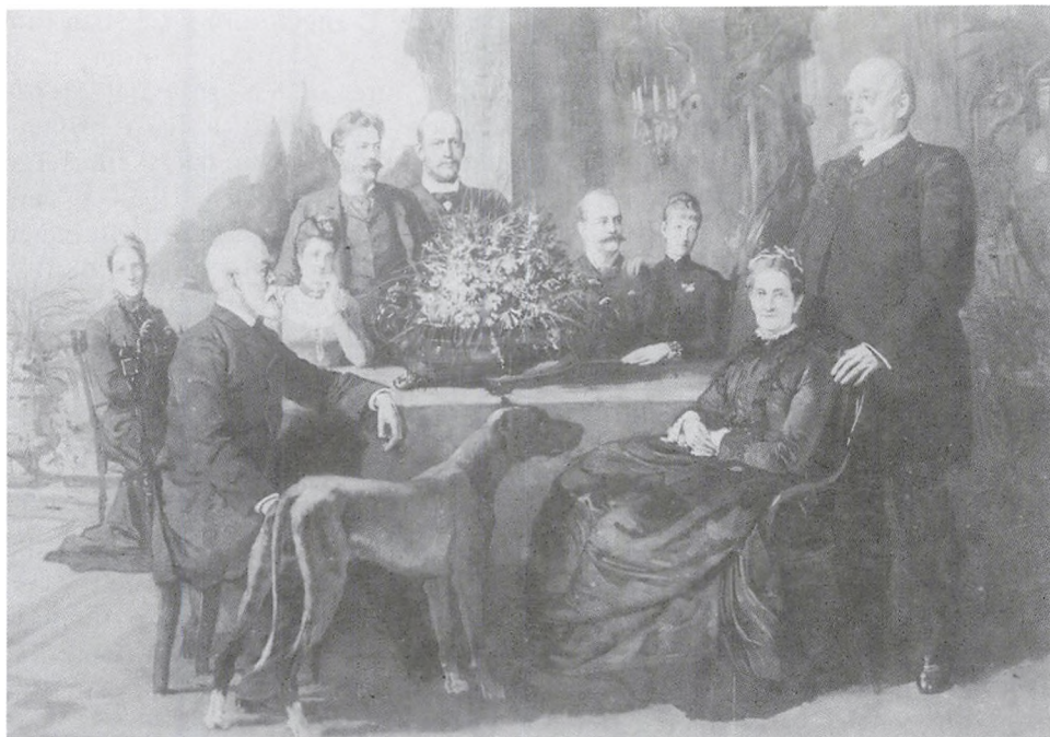
Tak til Bismarck, der her hygger sig i familiens skød, for hans 'nein' som sikrede Danmarks selvstændighed.

Der Nordschleswiger gav ikke hendes idé mange chancer. Hun er alt for erfaren til overhovedet at tro på det som en realistisk mulighed, skrev avisen. "Men hvis det kunne fremkalde større interesse for grænselands-spørgsmål i hovedstaden, vil hun sikkert også være tilfreds", fortsatte den. Forslaget var rundet af den senere tids begivenheder, og Eva Kjer Hansen "er som så mange andre danske parlamentarikere og ministre godt gal i hovedet og skidesur ("bitterböse und stinkesauer") på Kiel og især den ellers tidligere så højt skattede Peter Harry Carstensen, fordi han med sit spareforslag nu vil smide de spilleregler over bord, som siden 1955 har været gældende i mindretalsspørgsmål" (No., 16/9).