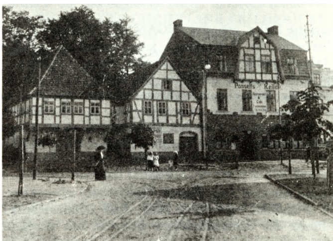
»POSSELTs KELLER«, Bad Schmiedeberg. (um die Jahre 1900-1912phot.)

»Dieser Keller existiert noch nach wie vor, heisst aber jetzt »Bergkeller«. Die dazugehörige Gaststätte ist nicht mehr in Privathand, gehört aber zur Kurverwaltung, und alle Villen um die ehemaligen Kurhäuser sind in staatlichen Besitz übergegangen. 1935 brannte das Gebäude Posselts Keller völlig ab und wurde neugebaut, so wie es jetzt noch steht. Unter der Schrift »Bergkeller« an der Aussenwand könnte man noch die alte Schrift »Posselts Keller« deutlich lesen. Ausserdem noch ein ganz undeutlich zu erkennendes Wappen.«