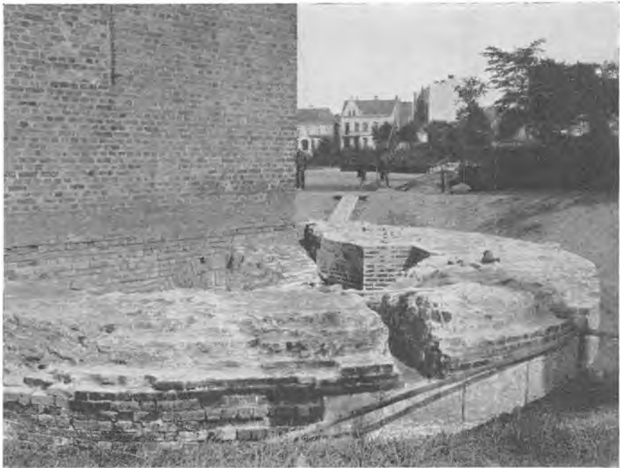
Rester af Blåtårn, hvor Christian II periodevis sad. Kun i Grevefejdens tid var hans fængenskab virkelig strengt.