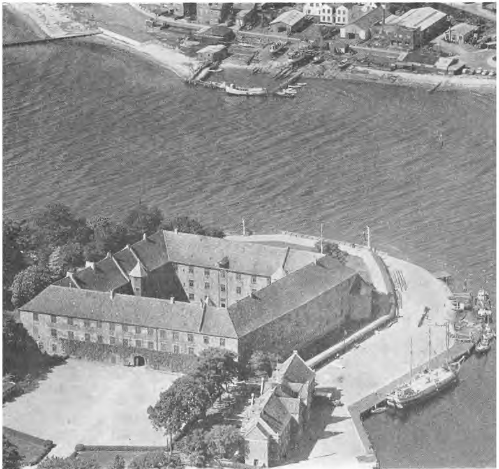
Luftfoto af Sønderborg Slot set fra Allsiden. Denne borg og dens indhold må og skal sikres.