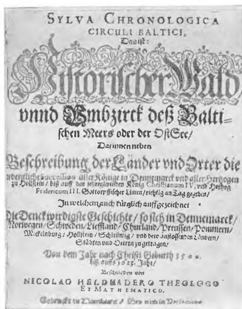
Sylva Chronologica s titelblad.

Königin nicht annemen, si muste dan auss Sweden ihre Testimonium aufflegen, das sie Erlich.