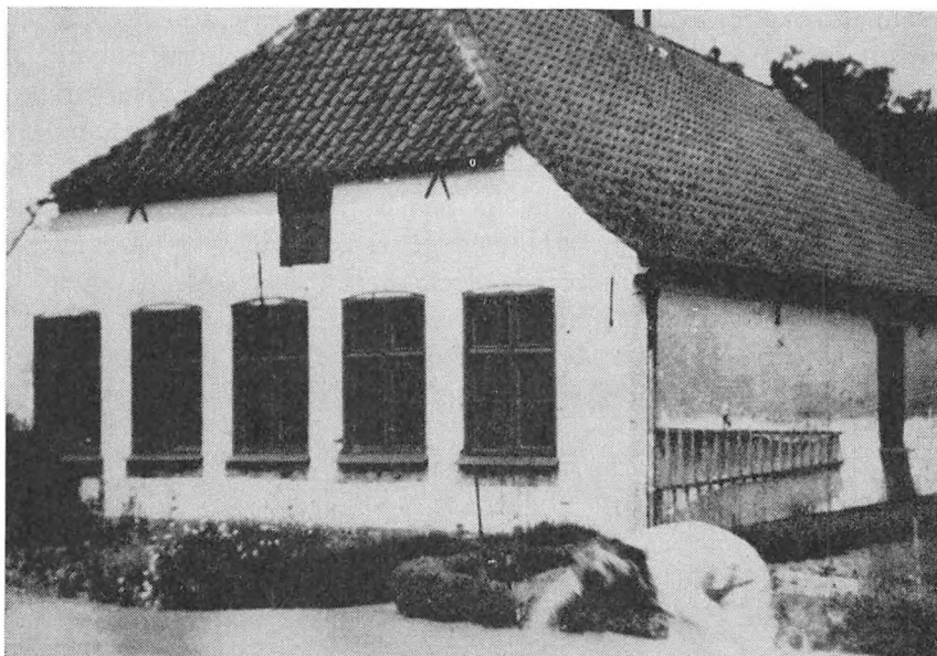
Notmark gamle skole.