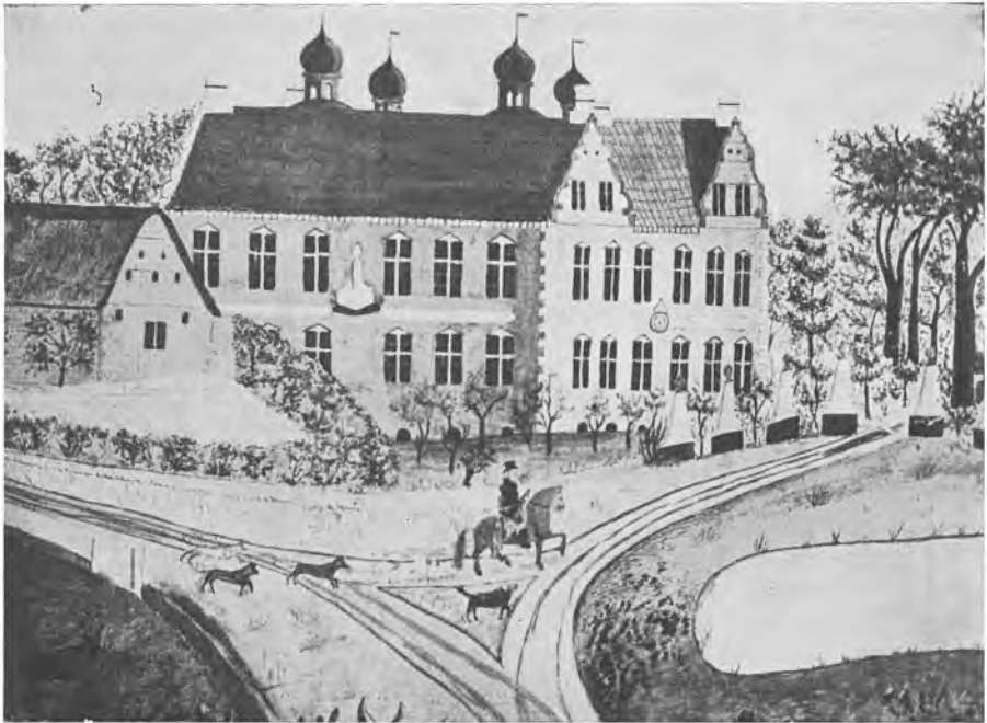
Tegning af det i 1854 nedrevne Trøjborg slot.

de fortrinlige Kjeldere kunne blive Plads til Oeconomien, i den halve Deel af øverste Etage til Forstanderen, og i den øvrige Deel af Bygningerne Plads til de fornødne Læsesale, Sovesale m: v:; og navnlig kunde der blive bedre Plads end paa Jonstrup, ligesom Seminariet vilde komme til at ligge i en dansktalende og meget dansksindet Egn af Hertugdømmet, ret bequemt beliggende, 7 á 8 Mile sønden for Kongeaaen.