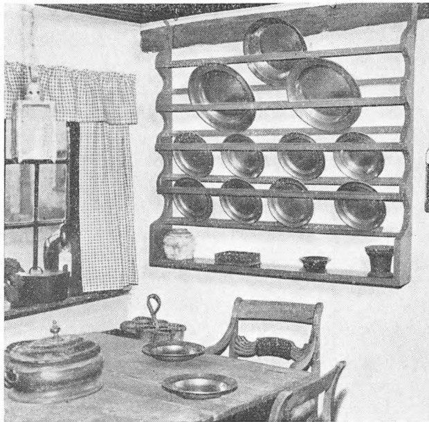
Et hjørne af køkkenet; tintallerknerne er fra 1742

og hvile, når man ikke bruger benene. Bommen er rigtigt hængt op og så tung, at den slår ved egen kraft – den konstruktion misunder være ved moderne væve mig.