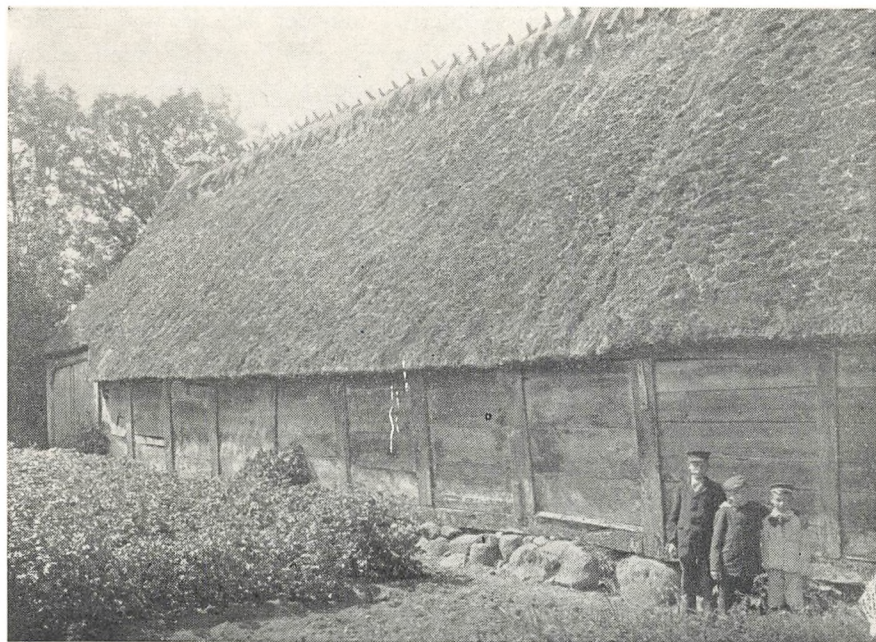
Varnæs præstegårds bulhuslade.