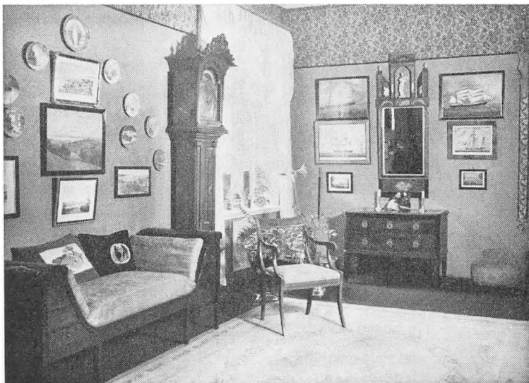
Fra amtslægens entre. Mens spisestuen var præget af almuekulturen, indeholdt entreen fortrinsvis købstadsmøbler, som den ejendommelige empiresofa, som i følge traditionen skulle være af russisk oprindelse, de fornemme franskeprægede, men sikkert hjemlige spejle, hvoraf der var 4. Et af de smukkeste ses her, det eksklusive Green-ur i dateret kasse (1742), den franske kommode. På væggene i dette rum var anbragt en del topografiske billeder, alle med tilknytning til Åbenrå, samt nogle sjældne og smukke bindebrev. I samme rum opbevaredes i en mahognivitrine amtslægens glimrende samling af sølv fra Åbenrå by, samt en heller ikke ubetydelig oldsamling. (S. Schoubye)

– Men Deres fars mange interesser må De have mærket allerede som barn?