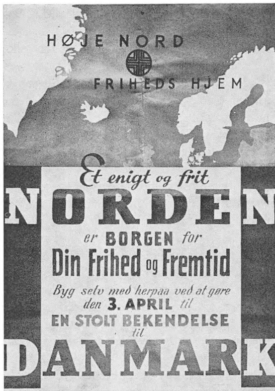
En af »Det unge Grænseværns valgplakater.

utvetydigt, men valgdeltagelsen, 92,4 pct., viste også, at man var »kommet alle mand af huse«. Herudfra var det også muligt så nogenlunde at bedømme det tyske mindretals størrelse, nemlig ca. 24.000 personer.