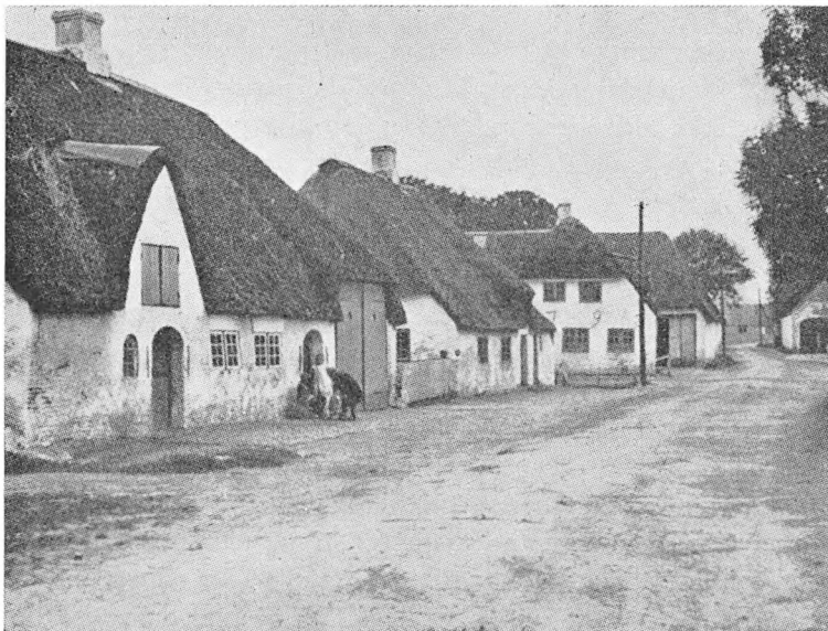
Gamle knapmagerhjem i Rørkær.

Der foreligger ingen oplysning om, hvorvidt krigsministeriets har accepteret tilbudet ,som sandsynligvis er blevet sendt. Måske er det gået på samme måde som i 1811, da knapmagerne modtog en lignende anmodning.