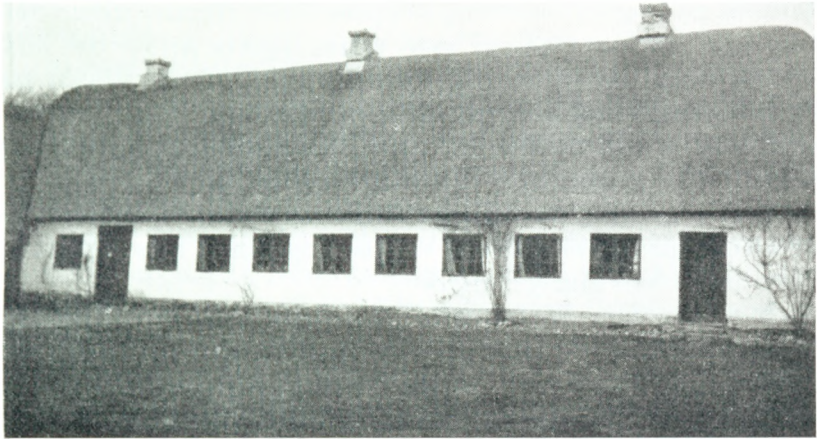
Den gamle Gaard i Ravnholt.