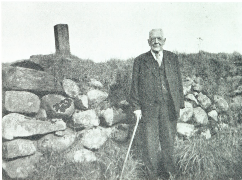
De fredede Rester af Donslund. 1953. Til højre Bogens Forfatter.