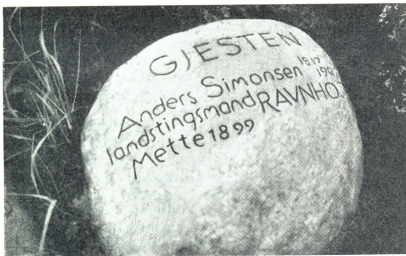
Stenen i Kongenshus Mindepark.

De sidste Aar, de boede paa Skødebjerg Nygaard, da »Støvets Aar« var naaet, og Kræfterne tog af, syslede han med lidt skriftligt Arbejde. Han havde historisk Sans og havde i sin Ungdom lyttet til de gamles Fortællinger, forstaaet deres Værdi, og nu genfortalte han disse Erindringer i en lille Bog »Nogle Oplysninger om Andst og Gjesten Sogne i de sidste Aarhundreder«. Overskrifterne til de forskellige Afsnit siger noget om Indholdet: