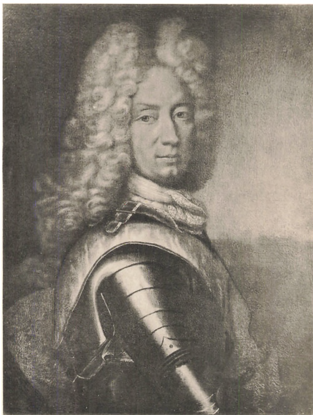
ADMIRAL C. T. SEHESTED