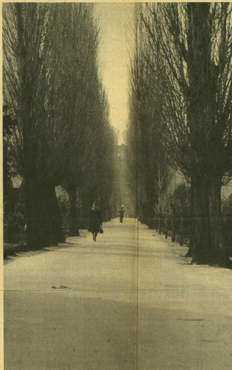
Der er smukt på de to gamle kirkegårde i det tidlige forår.

kunsten noget for sig selv. Drivende sentimental og temmelig vammel. Det er hovedindtrykket, når marmorderne, de sørgende engle og de itubrudte vaser passerer revy for ens indre blik efter et formiddagsbesøg på de to kirkegårde. Konditorkunst i kostbar sten. Fusk i marmor, som kunne have været brugt til noget betydeligt bedre. Og så er det alli-