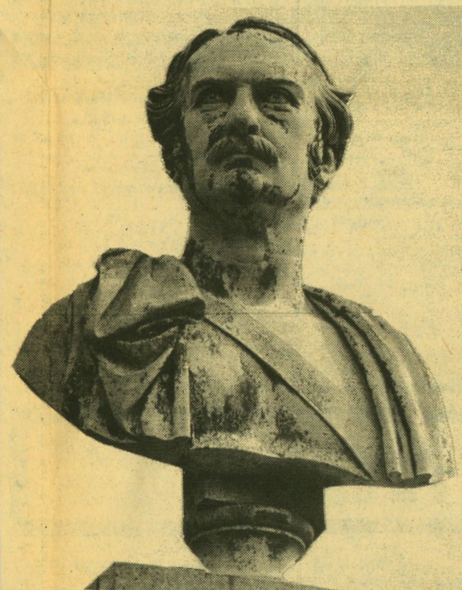
Olaf Rye - helten fra Fredericiaslaget

Men læg selv vejen omkring de to kirkegårde, og læg mærke til, at vel har Holmens og Garnisons den samme funktion, men alligevel er der vældig forskel på de to anlæg. Hvor Holmens er en smule dyster og højtidelig, åbner Garnisonskirkegården, der iøvrigt omgives af ambassadebygninger og beboelsesejendomme, sig mere for den besøgende, og er knapt så domineret af høje, hundrede og halvhundrede år gamle træer.