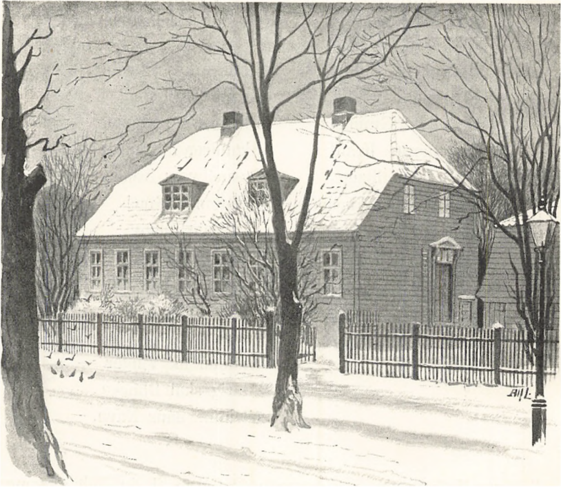
Ryes og Bülows Bolig paa Kastelsvejen.