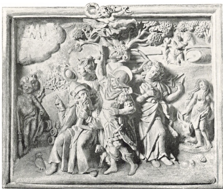
Epitaphiets nederste Felt.