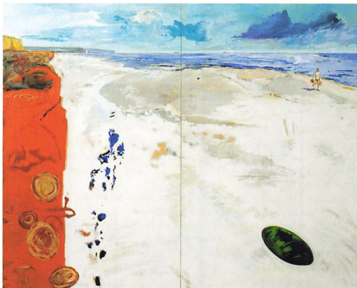
'En maler kom forbi', 200 x 260 cm, 2000-01 af maleren Jes Schrøder

kunstnerisk produktiv og udviklende periode. Han blev uddannet maler og grafiker ved henholdsvis Det Jyske Kunstakademi 1970-74, Kunstakademiet i København 1974-76, Den grafiske skole 1977-78 og ved den Kunstpædagogiske Skole 1978-81. Jes Schrøder var en landskabsmaler med et helt særligt farvesyn, der anvendte voldsomme farvekontraster i billederne. I Jes Schrøders landskabsbilleder findes også bylandskaber, hvor bygningskomplekser blev malet på linje med naturfænomener. Med denne nyerhvervelse er kunstmuseets samling beriget med et hovedværk af kunstneren med midler fra Ny Carlsbergfondet. ■