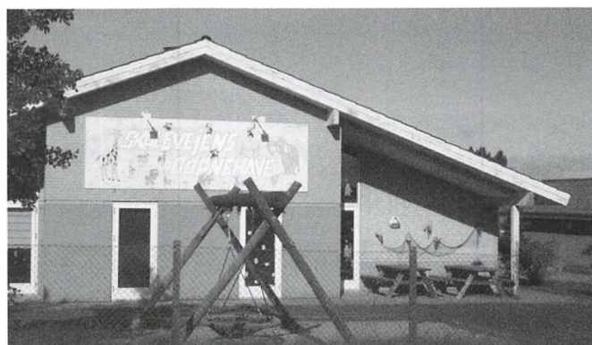
Skolevejens Børnehave i Sottrup