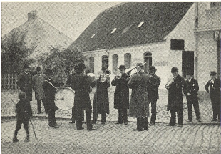
Byorkestret spiller til Nykøbings efterårsmarked i 1897

for ikke at sige næsten umuligt, at træffe en landspillemand, der kunne læse og spille efter noder, endsige nedskrive en melodi på et stykke nodepapir. Som følge heraf blev alle datidens melodier spillet efter hukommelsen. Det var slet ikke noget ringe forråd af melodier, spillemanden således måtte have på lager, thi en god spillemand måtte aldrig kunne sættes i forlegenhed af sit publikum.