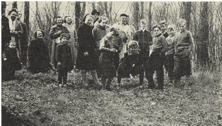
Der trilles påskeæg i Ordrup skov påskedag 1957

omtrent lige så mange voksne op. En hel del friske æggeskaller røbede, at der allerede havde været nogen at trille. Så begyndte æggene at rulle — alle de røde, brune, gule, blå og spraglede æg trillede og hoppede over det visne løv ned ad stiens æggebane og langt ned i dalen. Børnene fo'r bagefter og hentede deres æg op igen. Påny måtte de farvestrålende, hårdkogte æg tage turen ned. Når et æg ikke helt splittedes ad, så blomme og hvide sprang til hver sin side og forsvandt, blev resten af skallen fjernet, og ægget blev spist. Trilningen fortsattes, så længe der endnu var nogen, der havde hele æg tilbage af de 3—4 snese, som medgik, og som man i adskillige hjem dagen i forvejen havde gjort sig megen umage med at gøre festlige.