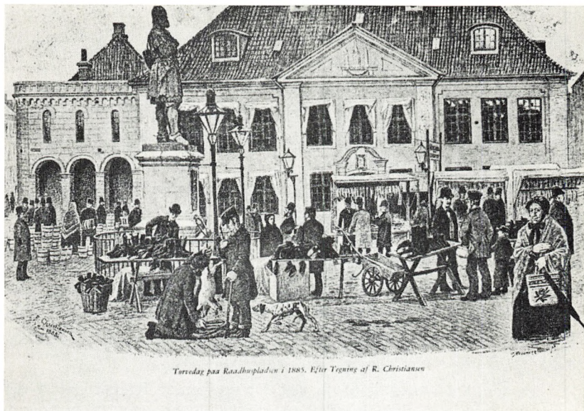
Torvedag paa Raadhuspladsen i 1885. Efter Tegning af R. Christianus

Gadenettet i en gammel by er sejgt, gaderne har hævdet deres plads lige til vi i vor tid er begyndt at lave om og »bryde igennem«. Derfor kan de gamle gader i Randers fortælle så meget om byens fortid, de har formet Randers gennem hundreder af år.