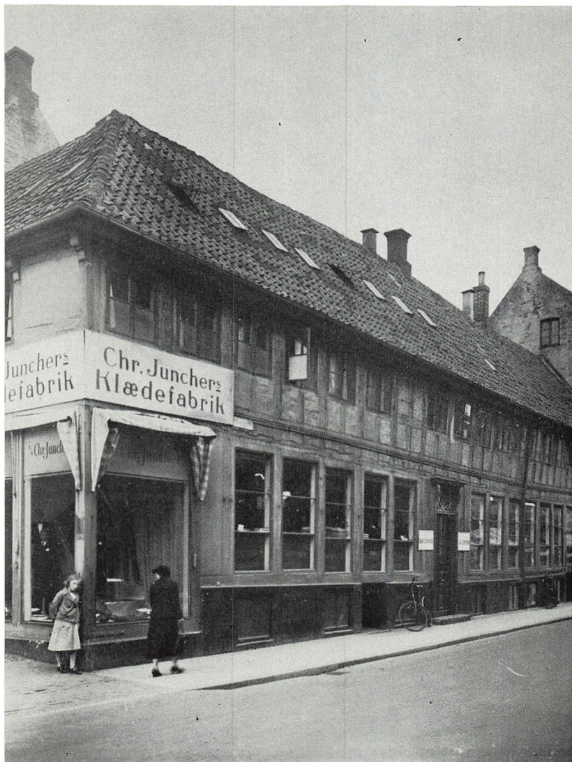
Slotsgade. Til venstre Helenestræde. Smuk gammel bindingsværksgård, der desværre nedbrændte i besættelsestiden.