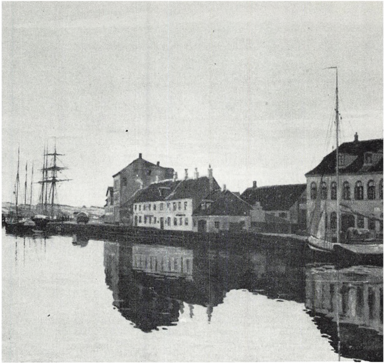
Randers-maleren Johan Rohdes maleri fra Randers havn ca. 1906.