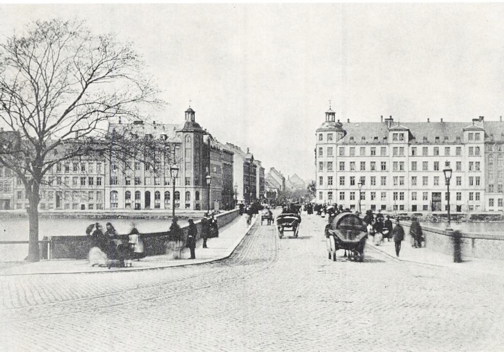
Den gamle Dronning Louises Bro. Øverst: mod Frederiksborggade, Nederst: mod Nørrebro (o. 1885). Den nuværende bro ligger lidt længere mod vest.