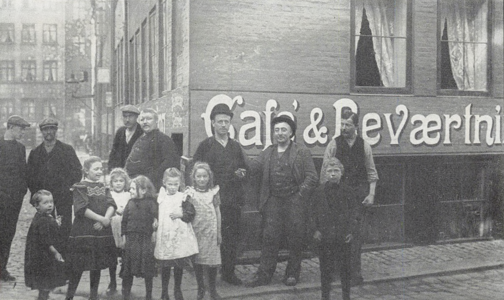
Hjørnet af Store og Lille Brøndstræde set mod Vognmagergade med café »Dukkehjemmet« (1908).