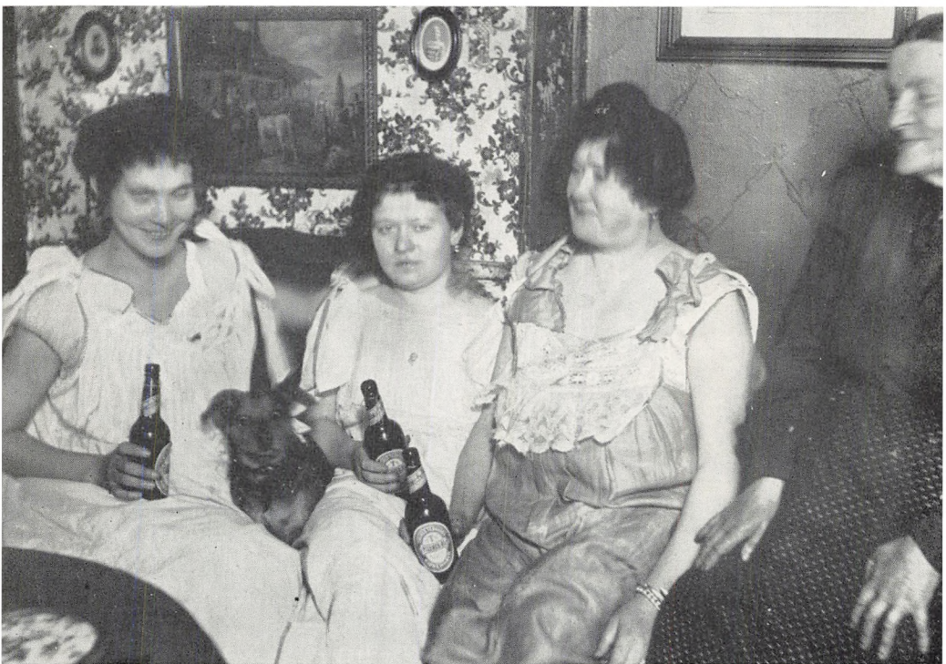
Tre »Holmensgade-piger« og deres »værtinde«.