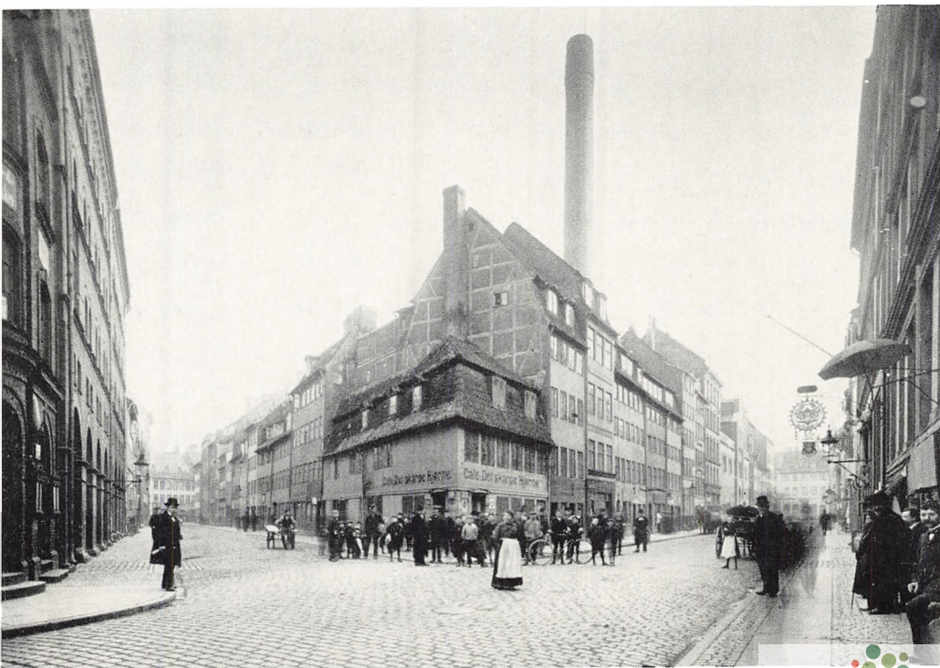
Adelgade mellem Helsingørgade og Gothersgade (1905).