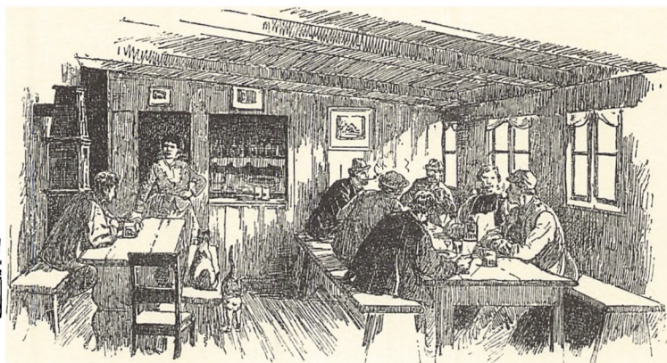
Tegning af »Lygtekroen« (ved århundredskiftet).

dens ende et plankeværk, der dannede skellet ud til en række gartnerhaver, hvor der fortrinsvis dyrkedes rabarber, hvilket gav anledning til, at kvarteret i folkemunde blev kaldt Rabarberkvarteret.