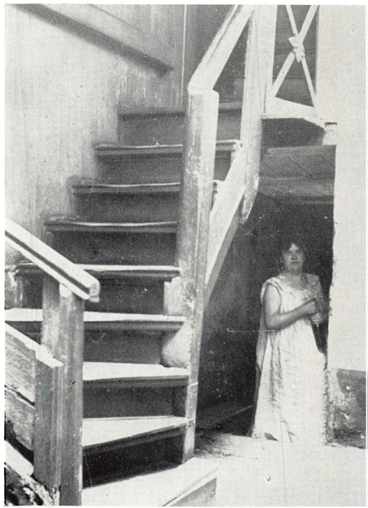
Trappegangen i forhuset til Holmensgade 11.