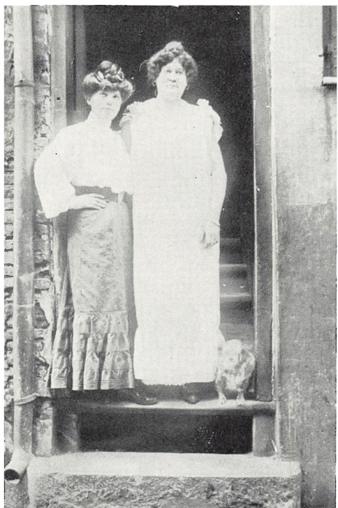
To »Holmensgade-piger« i sommerkjoler.