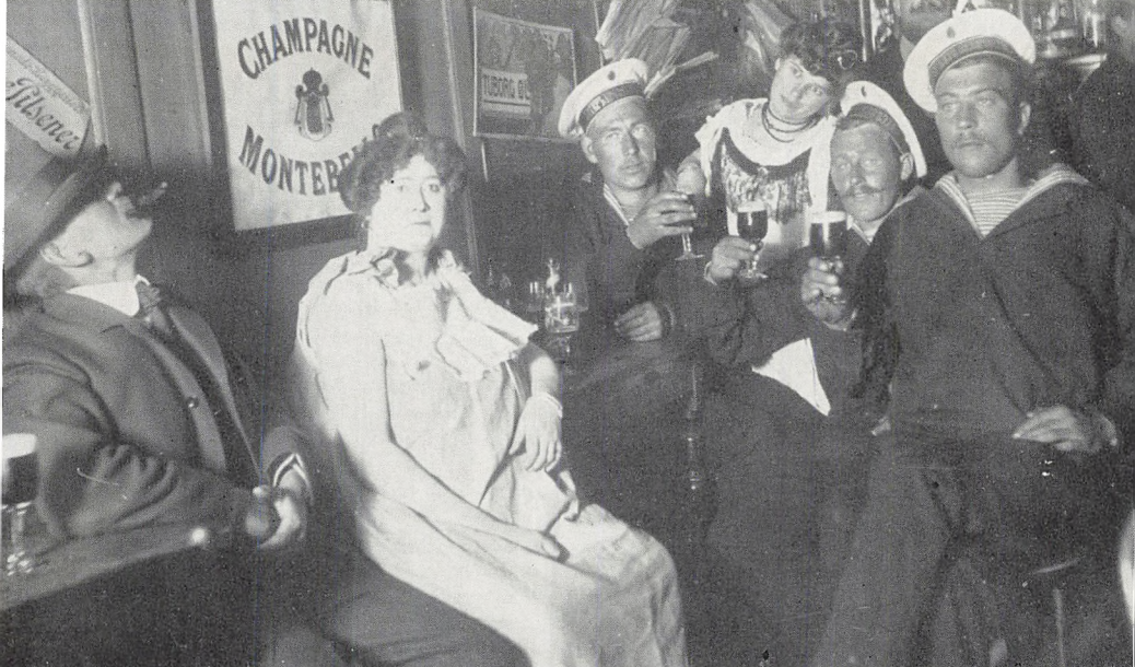
Russiske orlogsmatroser på besøg i »Det lille Apotbek«.