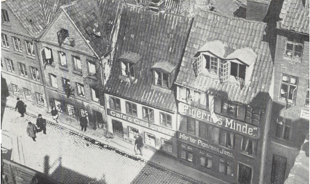
Holmensgade i fugleperspektiv.