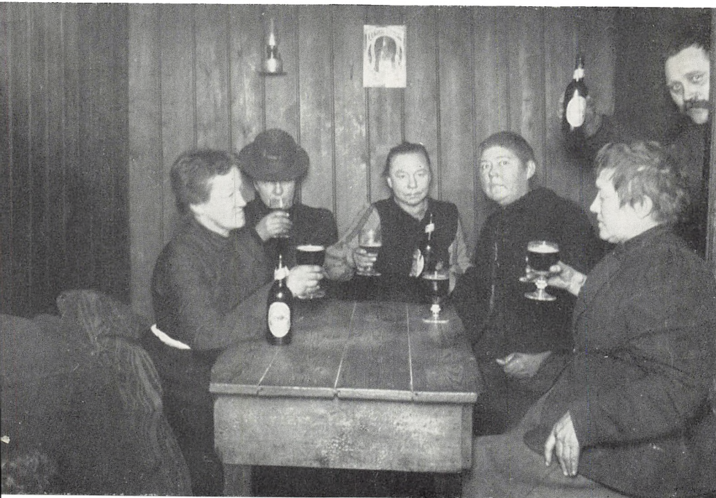
Beværrningen »Det lille Apotek« i Store Brøndstræde (1908). På bænken t. v. ligger en kvinde og sover rusen ud på stedet.