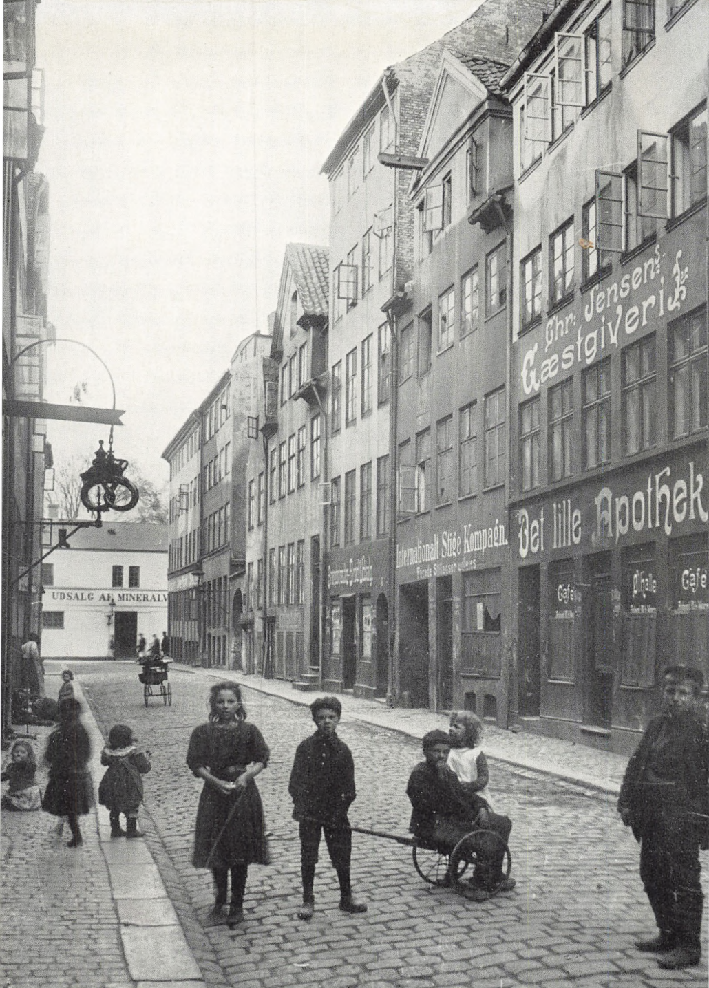
Store Brøndstræde set fra Vognmagergade mod Gothersgade (1908). Husrækken blev nedrevet 1909. T. b. »Det lille Apotek« – datidens ubyggeligste og tarveligste beverning.