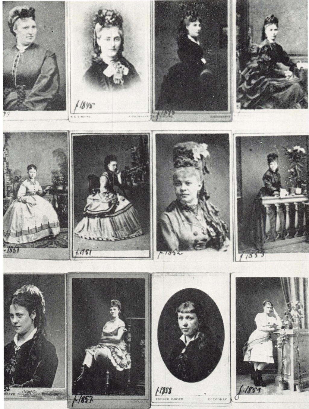
Løstgite kvinder fra omkring 1860—1870. Er de fleste ikke som taget ud af et gammelt familiealbum?