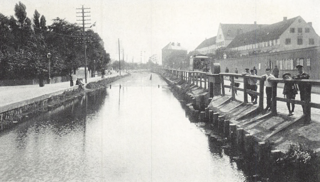
Ladegårdsåen mellem Blågårdsgade og Evaldsgade, set fra Blågårdsbroen. T. b.: »Kiøbenhavns Tvangs- og Arbeidsanstalt« (Ladegården). (1895).