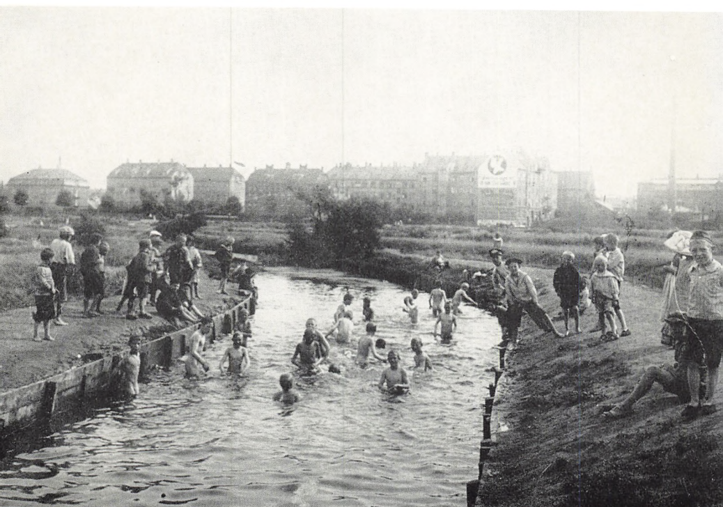
Ladegårdsåen mellem Borups Allé og Tisvildegade (ved Kronprinsesse Sofies Vej), set fra Borups Allé (1910).