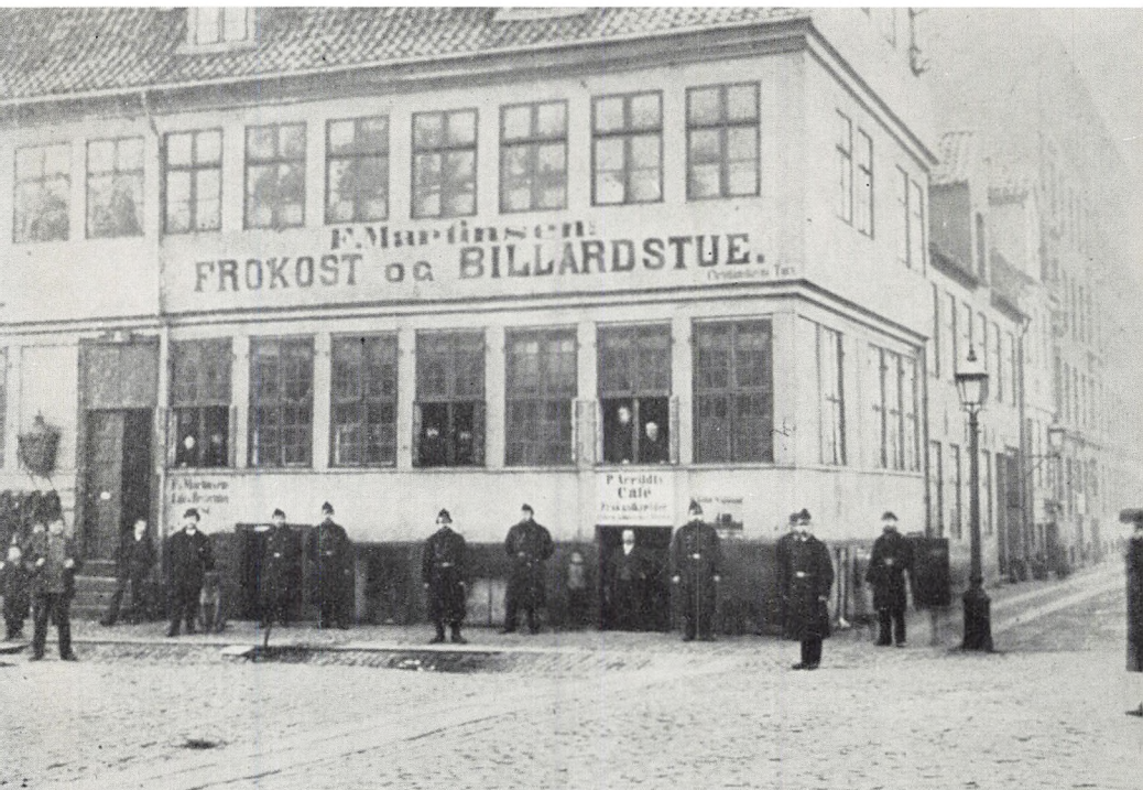
Politistationen på Christianshavns Torv. Bemærk fliserækken og den dybe rendesten (o. 1880).