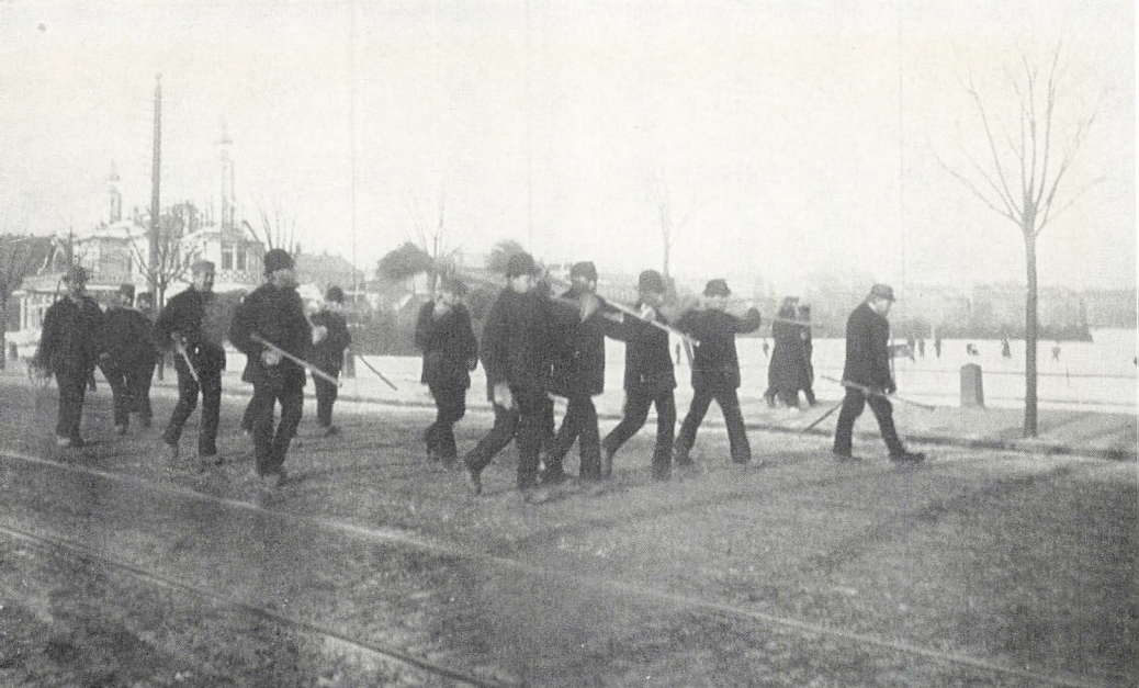
En afdeling »Ladegårds-Lemmer« på vej til gadefejning. I baggrunden ses »Søpavillonen« og Peblingsøen med skøjteløberbanen (1885).