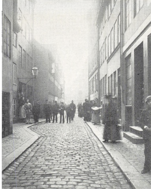
Holmensgade set fra Lille Kongsgade (1895).