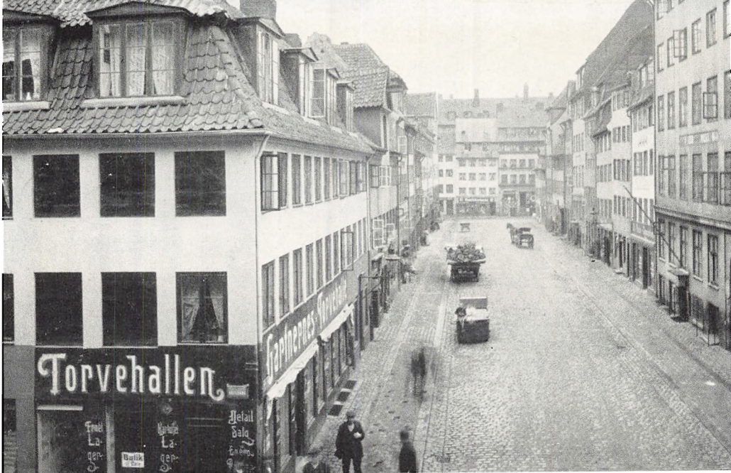
Prinsensgade set mod Adelgade.