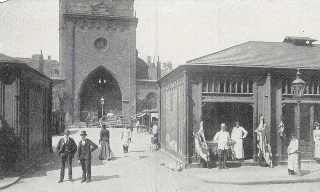
Slagterboderne ved Sankt Nicolai Tårn. Indkørselen til »Maven« set fra Nicolajgade (1910).