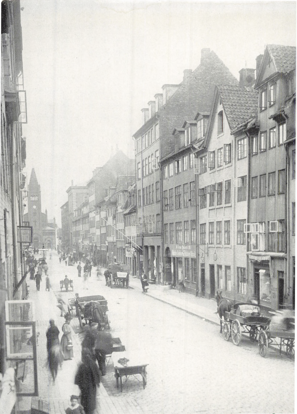
Adelgades nordlige ende set mod Sankt Paulskirken. Billedet er taget omtrent ud for Prinsensgade (1895).