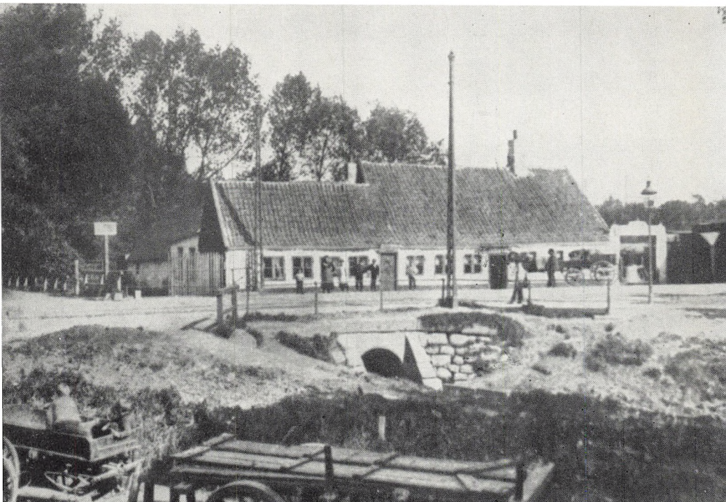
»Lygtekroen« på Frederikssundsvej. Under vejen går Ladegårdsåen, som ved århundredskiftet dannede grænsen mellem det yderste Nørrebro og Nordre Birk.