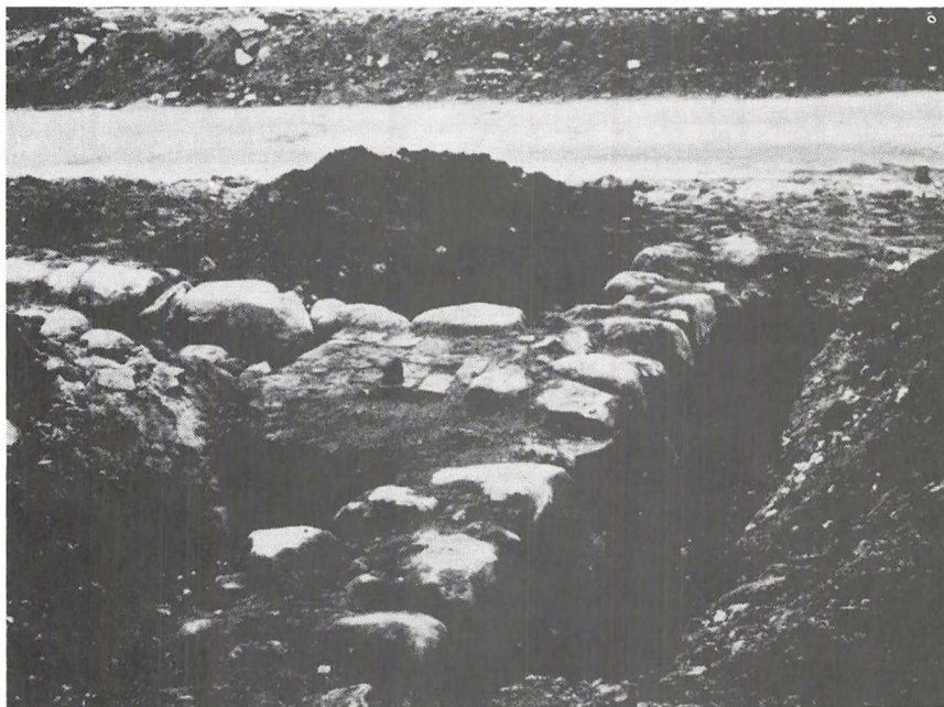
Billedet viser det solide fundament.