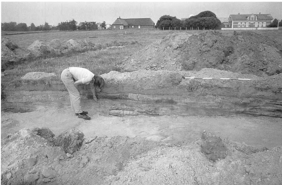
»Æ Bygsted«. I profilen ses sribede aftegninger, som er rester efter tørvevægge.

ser i seks af dem. Resultaterne af disse undersøgelser kunne tyde på, at de danske værfter er yngre end de tyske og hollandske. Det var derfor håbet fra museets side, at man gennem supplerende udgravninger i flere af de danske værfter kunne afvise eller bekræfte denne antagelse og samtidig få et nærmere indblik i, hvordan værfterne er opbygget. Haderslev Museum ønskede også at foretage arkæologiske undersøgelser på Rømø for at undersøge, om der på denne ø eksisterede værfter i middelalderen.