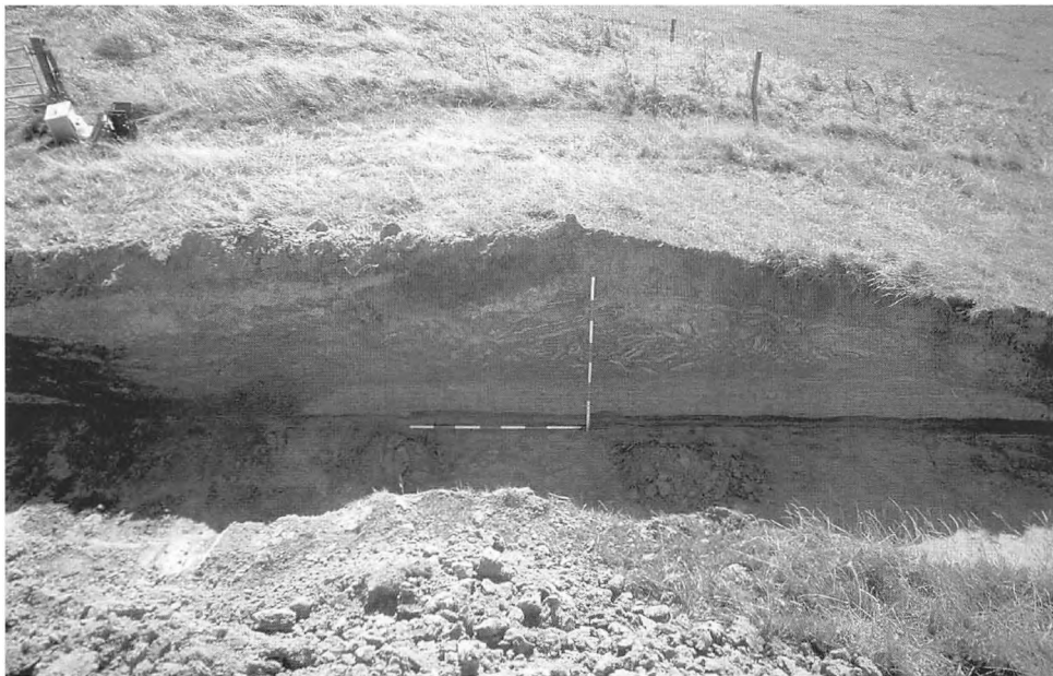
Snit gennem sommerdiget ved Misthusum.

Fra det nordlige Rømø flyttede udgravningsholdet til den sydlige del af øen. Her findes et stort ubebygget område, der kendes under navnet Tagholm. Stednavnet kan spores tilbage til middelalderen. Området ligger ganske tæt på kysten og er kendetegnet ved klitdannelser. På terrænet ligger flere store kampesten, hvilket er et sjældent syn på Rømø. Disse kunne tænkes at stamme fra en bygning. Men udgravningsholdet var ikke heldigt denne gang. Der blev ikke fundet spor efter bygninger under prøvegravningen