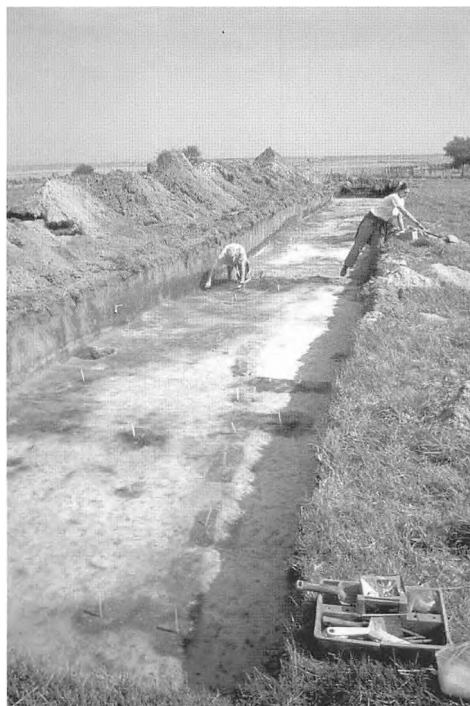
Søgegrøft gennem den nordligste lokalitet i Juvre. I forgrunden ses spor efter ildsted og tørvevægge.

Dateringen af værfterne i Danmark bygger på langt mere usikkert grundlag end syd for grænsen, hvor udforskningen af værfterne har været mere omfattende og intensiv, end tilfældet hidtil har været i Danmark. I den danske del af marsken er der registreret ca. 50 værfter, som alle ligger i Tønder- og Ballummarsken, men der har kun været foretaget undersøgel-