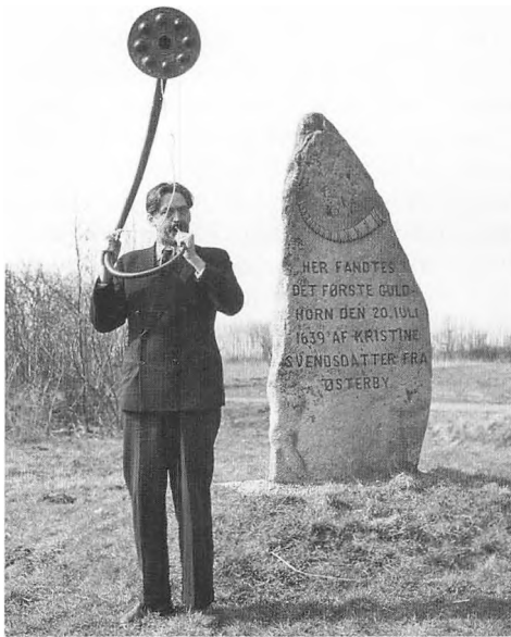
Senere rigsantikvar P.V. Glob (1911-1985) blæser her på en kopi af en lur fra bronzealderen foran en af mindestenene i Gallehus. Årsagen og tidspunktet kendes ikke.

Sådanne ord kan nok i dag genere de fleste museumsfolk, som i alt fald ikke selv synes, at de famler i tåger og søreme også værdsætter de besøgendes nysgerrighed, om end deres blikke monne være matte. Hertil lægges en vished om, at selvsamme Oehlenschläger i 1832, som professor på Københavns Universitet, var den, der lagde navn til, at en samling oldsager skulle ud af Universitetsbibliotekets lokaler. Oldsagerne var udstillet på loftet over Trinitatis kirkes kor. Oehlenschlägers begrundelse var, at biblioteket selv havde brug for lokalerne til bøger, at oldsags-samlingen var blevet for stor, og ikke mindst, at den blev forevist af personer, som var aldeles fremmede for biblioteket og for størstedelens vedkommende også for Universitetet.