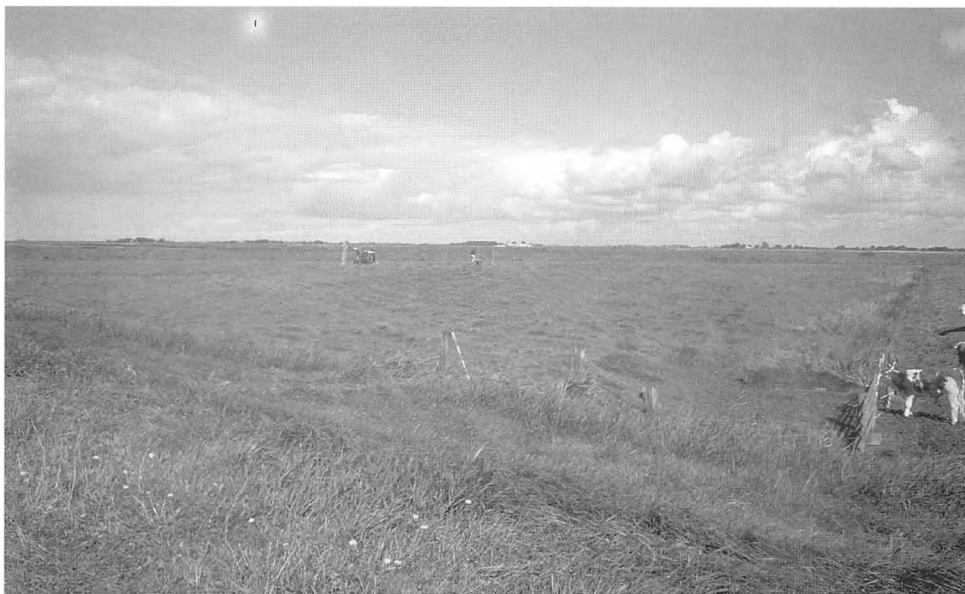
Rudbøl kog. Seifferts værft.

Fra Forballum drog holdet videre sydpå til Rudbøl- og Gl. Frederiks Kog. Her ligger flere forladte værfter som små øer i det ellers helt flade, fantastiske landskab. I dag forekommer landskabet, i hvert fald