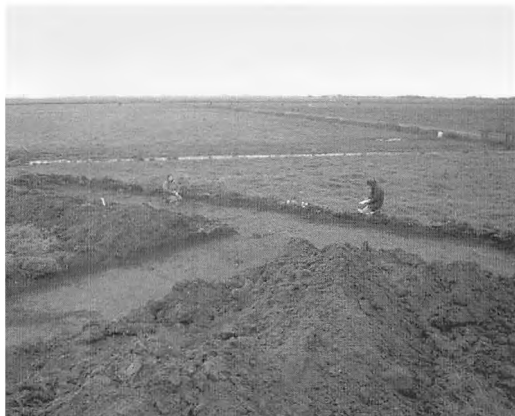
Gl. Frederiks Kog. Inspektor Værftet.

for byboere, ved første øjekast barsk og øde. Det mærkede udgravningsholdet, som måtte hente vintertøjet frem, selvom det kun var september. Men klimaet og de barske forhold har ikke afholdt folk fra at bosætte sig herude. Først i 1800-tallet opgav folk gårdene og flyttede væk.