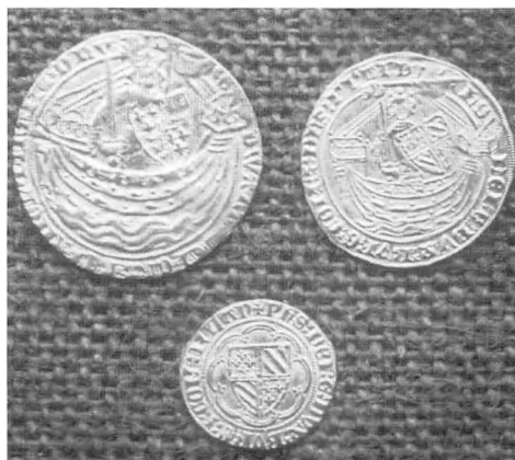
3 guldmønter fra 1300 og 1400-tallet, fundet på Rømø kirkegård.

I dagliglivet var der dog kun småmønter i omløb. Guldmønterne havde så stor værdi, at de kun blev brugt til store forretninger, f.eks. skibskøb, eller samlet af velhavende, der kunne spare penge op. De tre mønter, iøvrigt det største gravfund af den slags i Danmark, repræsenterede i 1400-tallet værdien af ca. 7 tdr. smør (over 1500 pund) eller omtrent værdien af 130 par sko. Det svarede også til værdien af 100 lam eller hen ved 20 årslønninger for en ansat på en af datidens storgårde. I dag er guldværdien af de tre mønter dog »kun« ca. 1.300 kroner. Det må have været en rig mand eller kvinde, der blev begravet på Rømø kirkegård. Det har været en person med betydelige