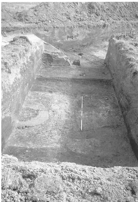
Forballum. Stolper, brønd og rester efter brændte tømmerbælter fra middelalderen.

af området, hverken fra middelalderen eller nyere tid. Der skal måske søges noget sydligere en anden gang.