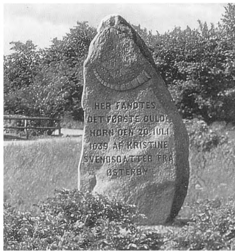
Mindestenene for fundet af de to guldhorn i 1639 og 1734 blev rejst på det omtrentlige findested i 1907. Det er bemærkelsesværdigt, at inskriptionerne er skrevet på dansk.

videre til Antikvitetskommissionen. Her var guldhornene udstillet.