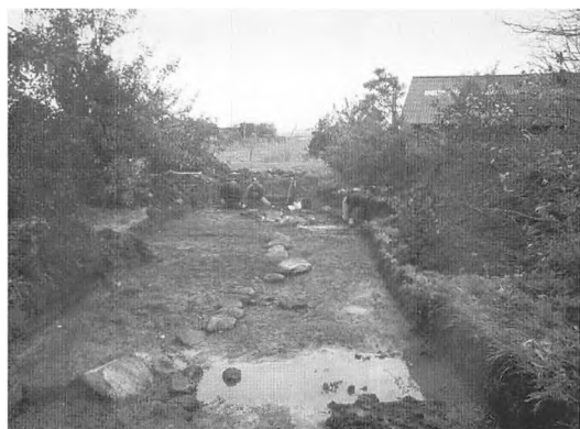
Rudbøl. Syldsten fra en bygning fra middelalderen.