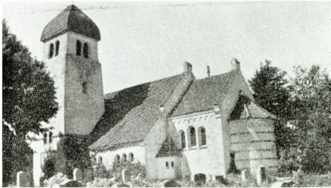
Højerup ny Kirke