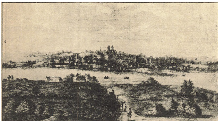
Viborg omtr. 1730.

til Asmild. Tidligere var der nemlig kun Baadfart over Søen. Efter Tegningen i Resens Atlas fra omtr. 1677 var Overfartspladsen oprindelig i Søndersø ud for det daværende »Mellemsøstræde«, den Vej, der nu fører ned til det saakaldte »Ny Brænderi« (anlagt 1842). Senere foregik Overfarten ifølge Planen over Viborg By i Pontoppidans »Danske Atlas« fra en lille Tange i Nørresø ud for »Nøresøgyde« omtrent ved den nuværende Danse-