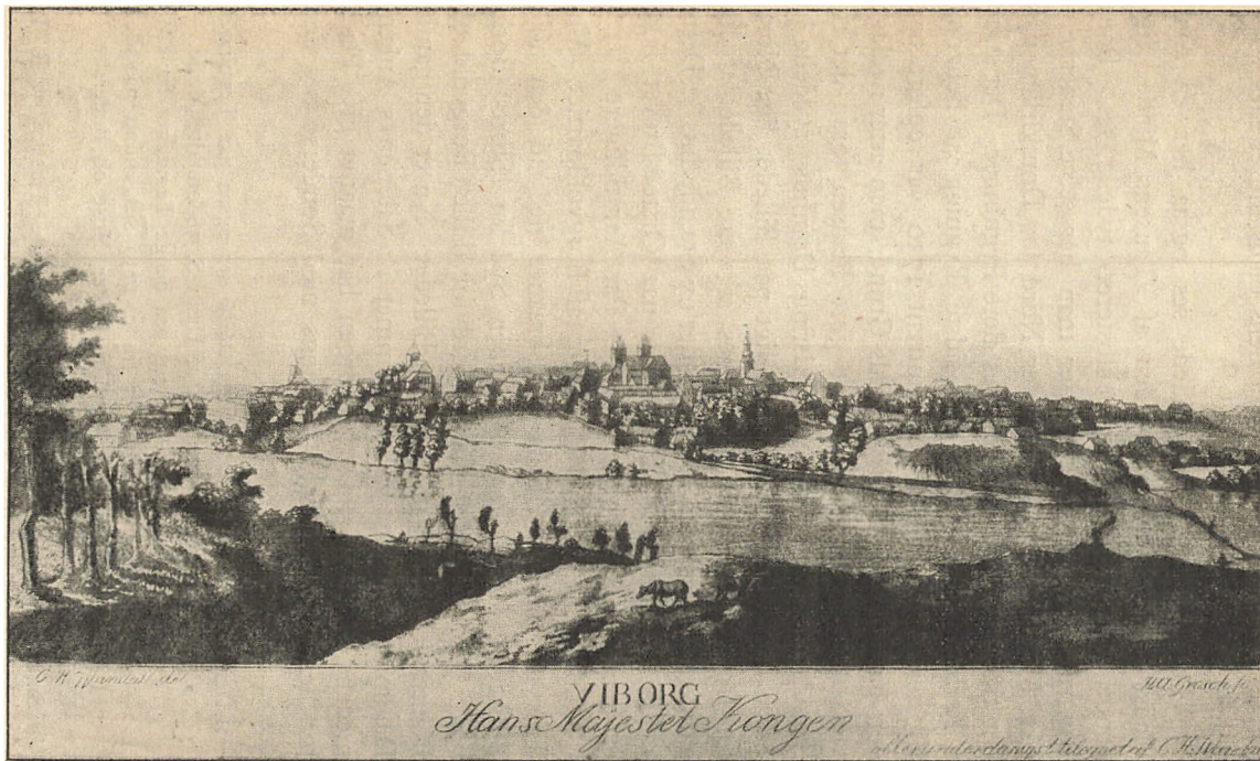
Viborg omtrent 1810—12. (Stik af H. A. Grosch [1764—1842], tegnet af Wandal.)