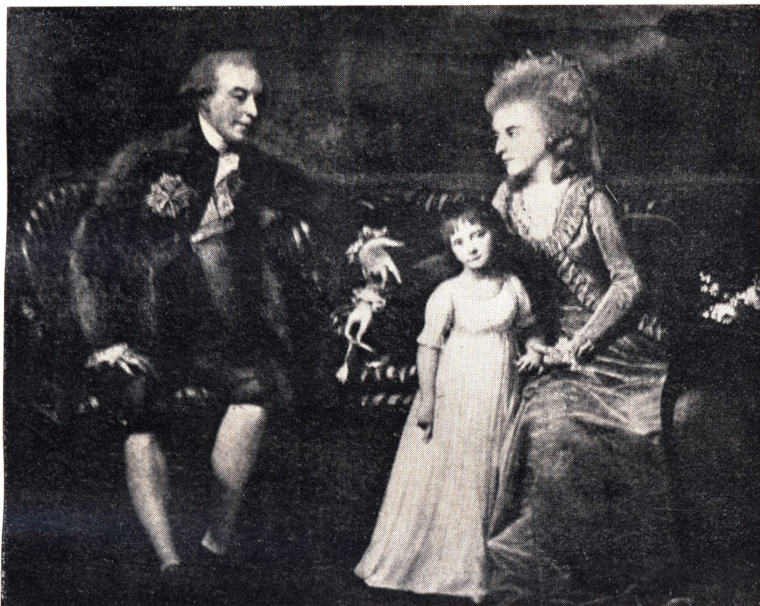
Efter maleri af Juel.