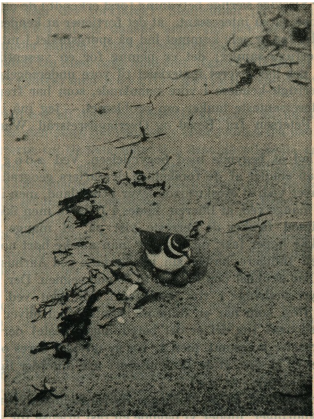
Præstekrave. Ægialitis hiaticula .

— Jo, for en Fugleven er Jordsand et Paradis, man bliver aldrig træt af at iagttage Livet herude, for hver Dag, hver Flodbølge byder paa noget nyt, skønt og dejligt, undertiden ogsaa stort og mægtigt, naar Havet rejser sig i sin Vælde og raser omkring den lille græsklædte Ø, der endnu har trodset Havet, men maaske en Dag maa bukke under for ikke mere at rejse sig over Overfladen af Vadehavets Tidevand.