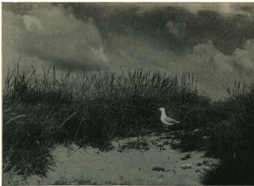
Sølvmaage. Larus argentatus .

daglige Vandstand hæver den sig næppe mere end 2 Meter over Havets Overflade, og under Vinterhøjvande gaar den meget tit helt under Vand. Værst for Øens Vedkommende er det, naar Vandet lige naar op til Randen, hvor det saa staar og udhugger Siderne og æder sig længere og længere ind paa Øen. Paa denne Maade synker tit store Stykker i Havet; lidt lægges til igen ved Syd- og Østsiden, men det er ikke saa meget.