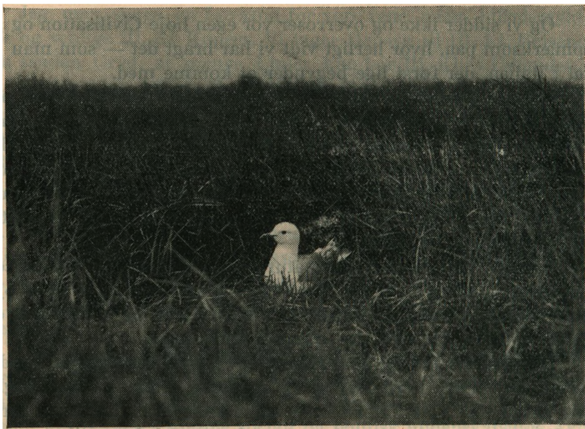
Stormmaage. Larus canus .