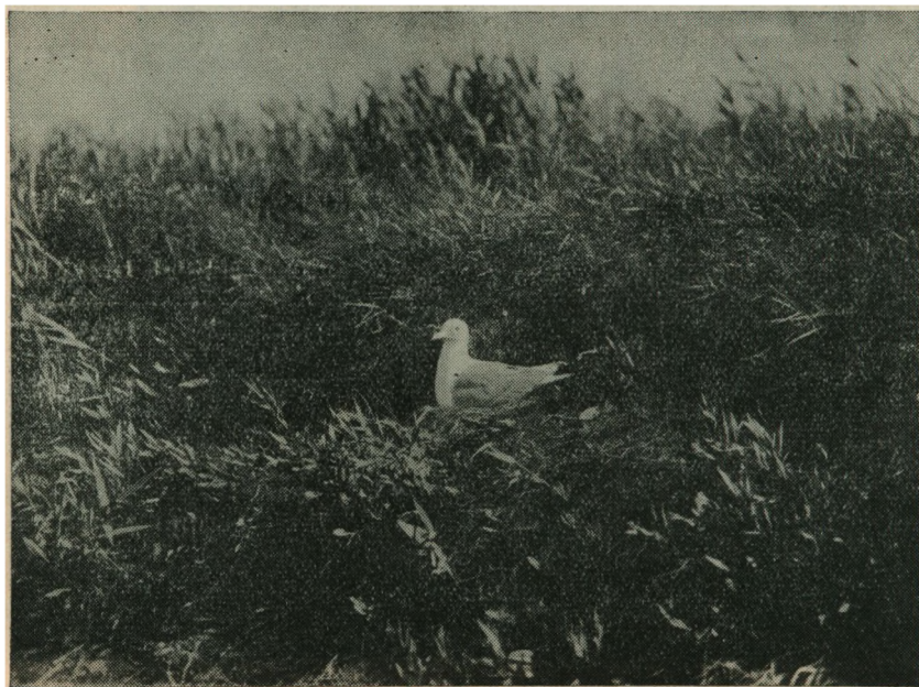
Stormmaage paa Reden. Larus canus .

Endnu saa sent som i Begyndelsen af det attende Aarhundrede har Jordsand vaeret bebygget. Nu er den for lille dertil, og det vil