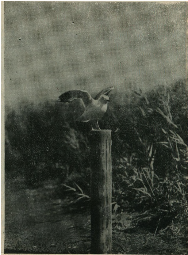
Stormmaage. Larus canus .

Foraarstrækket slutter saa sent som midt i Juni, hvor de sidste Smaaflokke af Ryl er forlader Øen og gaar mod Nord til Ynglepladserne for allerede igen at indfinde sig her i Slutningen af Juli. Rylen er en utrolig rapvinget Fugl, har sjælden Ro paa sig, men haster omkring tidlig og silde for at finde Føde. Samtidig med Rylen eller lidt senere indfinder Kobbersnepperne og