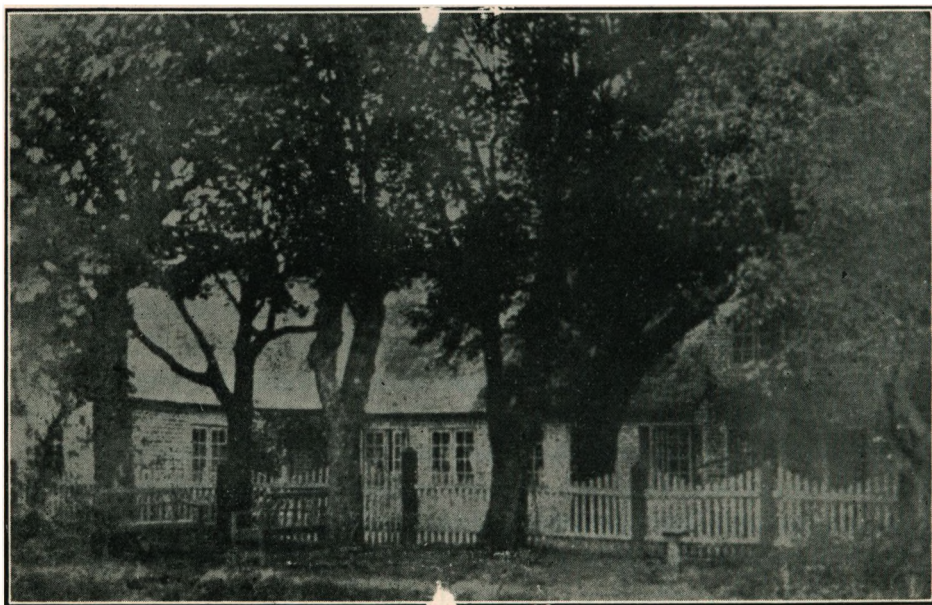
Døstrup gamle Præstegaard.