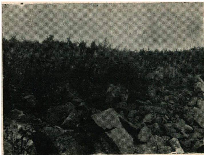
Sprængt Fæstningsanlæg i Gasse Skrup.