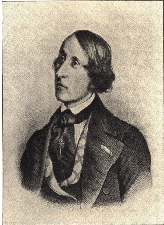
H. C. Andersen. Træsnit i Illustrierte Zeitung, 30. Jan. 1847. 8. Bd. Nr. 187. S. 72.