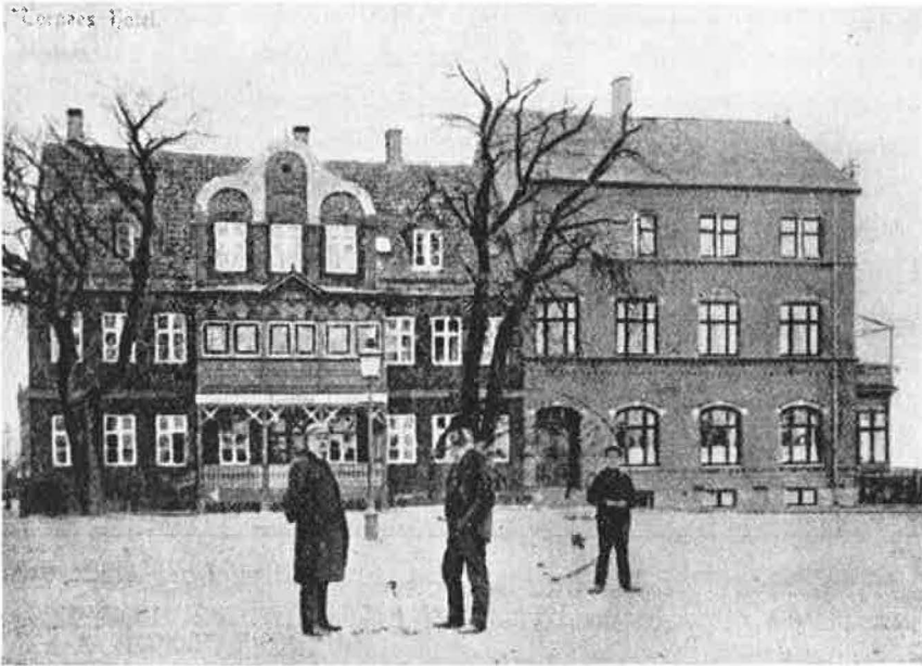
"Tornøes Hotel" efter 1900.