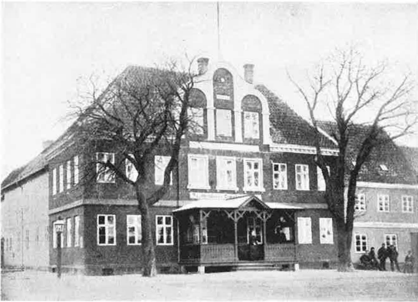
"Tornøes Hotel" med den i 1908 nedbrændte Theaterfloy sængst til venstre, Berættningen "Briggen" tilhøjre.