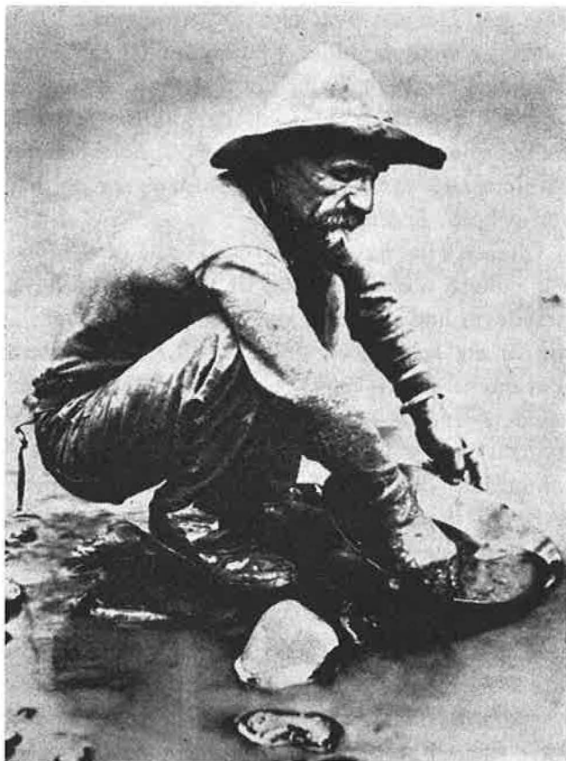
Guldgraver vasker guld. Foto fra c. 1850. (Alistair Cooke).

af 3 til 50 fod, indtil man kom til en hvidagtig lerbund eller en fast stenmasse. Det var altid et lykkespil at finde guld. Enkelte huller gav rigeligt udbytte. Der var i et sådant hul fundet indtil 100 pund vægt. Men i de fleste huller fandt man kun lidt eller intet. Det højeste Hay havde fået i udbytte af et hul var 5 pund guld, men i de fleste huller havde han intet fundet. Det største stykke guld var fundet ved Sidney; det vejede 101 pund.