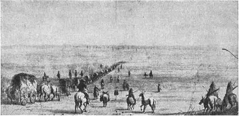
Vogntogene over prærien. Maleri af A. J. Miller fra midten af 19. årh. (Efter Alistair Cooke's America).

vaskedes. Efter at de havde arbejdet 10 dage i „Drewton“, et sted, der kaldtes „Organ Krich“, blev vandet knapt der, hvorefter de forsøgte flere andre steder. Efter at Hay havde været i minerne omtrent 8 måneder, rejste han og hans partner alsingen til San Francisco for at søge arbejde. Forinden tog han tilbage til „Susperans“ for at hente sit tøj, men de folk, han havde leveret det til, var i mellemtiden rejst til en anden plads, så han mistede det hele. De vandrede derefter den 40 miles lange vej til „Stocking“. Herfra tog de med dampskibet til San Francisco, hvortil de ankom en tidlig morgen i juni.