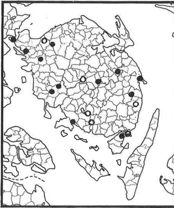
Omstående kort viser grundlovsege (●) og andre mindetræer (○) på Fyn.