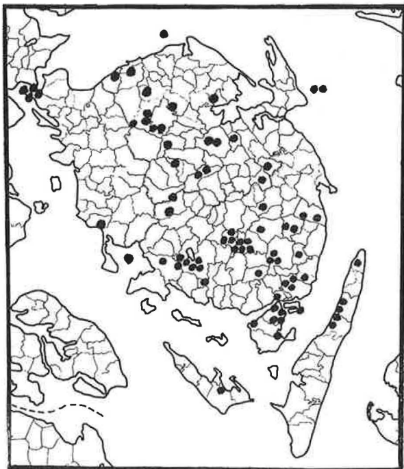
Navngivne træer på Fyn.

De hellige Træer har stået i Lundsskoven, Åsum s. 44