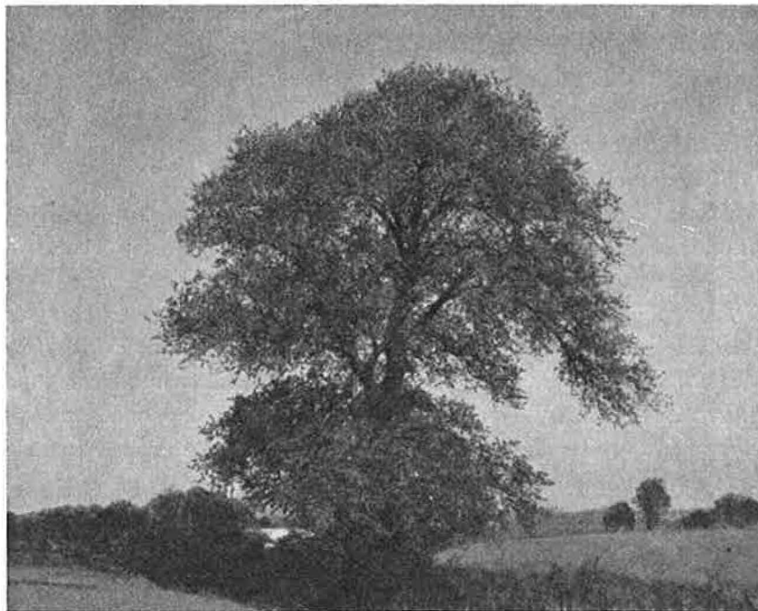
Elm ved Egelund, Rask-slægtens vænetræ.

Trankær-grevens skæbne var knyttet til en nu ukendt eg, Grevens Livstræ i en skov ved Bøstrup. 72 Slægten Rask holdt gennem generationer familieråd under „vænetræet“, en stor elm i dige ved Egelund, og traf dér store beslutninger. 73