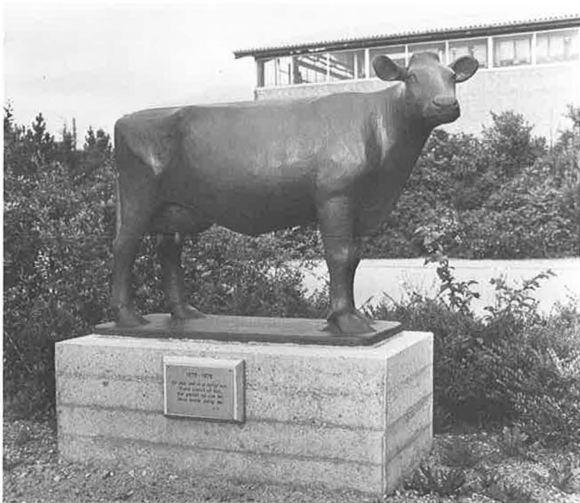
Grdr. J. Illum Møller bekostede rejsningen af et minde over den røde fynske malkeko, der i 1978 som race havde været anerkendt i 100 år. Skulpturen er iøvrigt det eneste dyr, der på Fyn er opstillet som et minde, og den står ved landboauktionerne i Ringe. Afsløringen skete i en forrygende snestorm 28. december 1978. Ved nytår 1980 er den det sidst opstillede minde.

Hvis vi skal tage de nyeste mindestene først, så må vi tilbage til 1978. Ingen blev afsløret i 1979, ihvertfald ikke på offentlig grund.