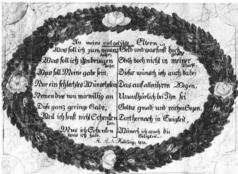
Mindeblad med købeblomster, 1824.

Disse ofte helt igennem hjemmelavede hilsener svarer til vore dages blomsterbuketter. Det var før blomsterhandlerens tid, og at komme med en buket fra egen have var der ingen plan i, for modtageren havde højst sandsynligt selv have med de samme blomster som alle andre, for der var også mode i haveblomster. Et mindeblad kunne man variere, man kunne vise sit talent, man kunne lægge venlige og kærlige følelser i det.