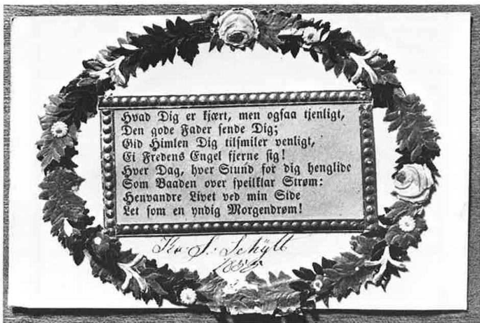
Mindeblad med købeblomster, 1855.