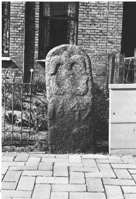
Byfredsten på Skt. Jørgens Gade.

Hanebæk havde dog ikke sit udspring ved Paaskes Høi eller Paaskes Banke, og sådan har Engelstoft da heller ikke tegnet bækken på sin gengivelse (Pl. III) af J. Themsens kort fra 1717, og sådan er den heller ikke tegnet på originalen til dette kort. Bækken er begge steder tegnet med udspring i den dam, som nu indgår i friarealet til Borgerhus, d.v.s. ejendommen Skibhusvej 25, hjørnet af Bredstedgade. Bækken fulgte på en strækning skellet mellem Kræmmermarken og Marienlund. Umiddelbart inden den krydsede Skt. Jørgens Gade dannedes en dam, Gummes Dam eller Gummes Kær, som »først i vore Dage« er blevet udtørret. Engelstofts bemærkning om, at vandet »nu har fået afløb til Canalen« må bero på en misforståelse.