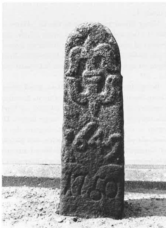
Byfredstenen på Tolderundsvej.