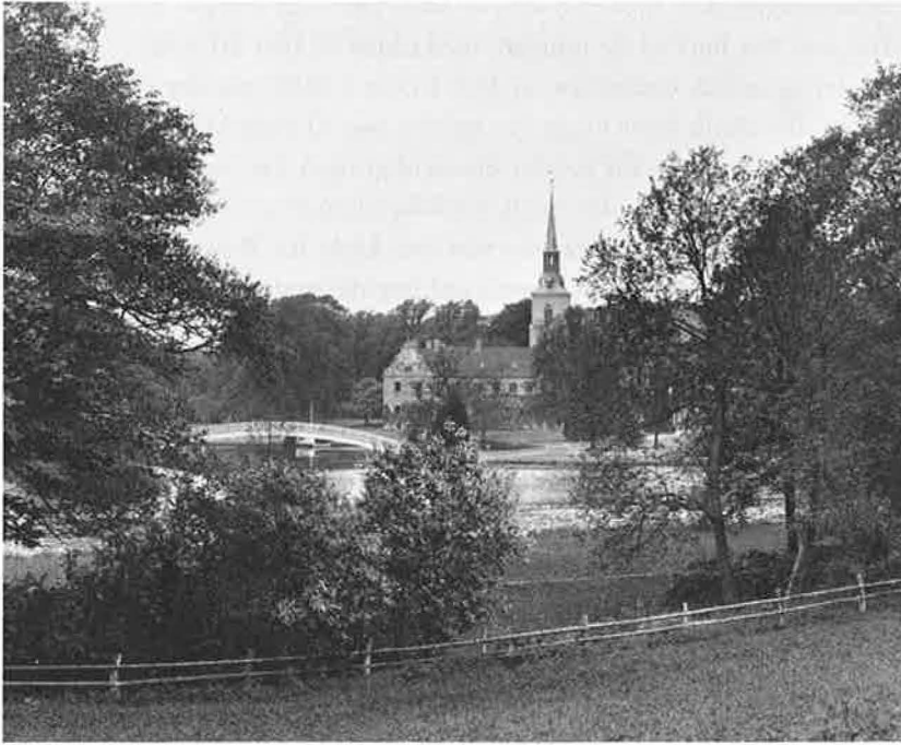
Brahetrolleborg fra sydøst, i forgrunden Mølle dammen. Fotografen har stået i lavningen mellem Møllebanke og Grønhjerg (foto i Brahetrolleborg Folkemindesamling, Gærup).

tidligere skøder blot opregnede gårde og landsbyer, hører vi nu, at der i virkeligheden hørte skov til næsten alle klostrets besiddelser. Dette siges udtrykkeligt om gårdene i Gærup, Fleninge, Hågerup og Grønderup, om de tre små samlinger af gårde og huse, Nybygd Gårde, Fagsted og Nybo, og om avlsgårdene Fiskerup, Brændegård, Kragegård og Sølvbjerg.