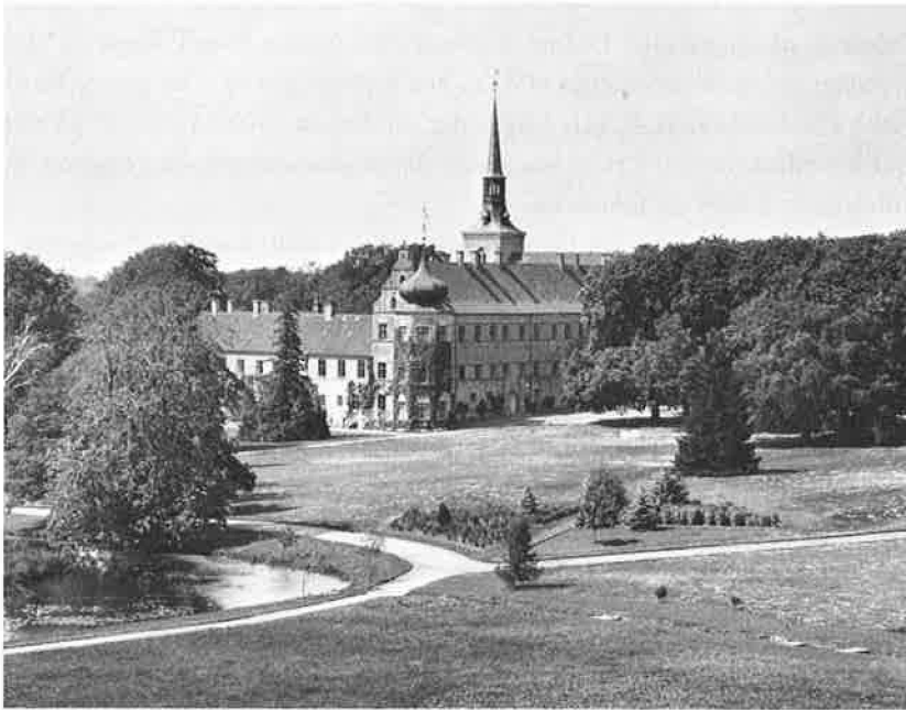
Brahetrolleborg slot og park set fra sydøst.