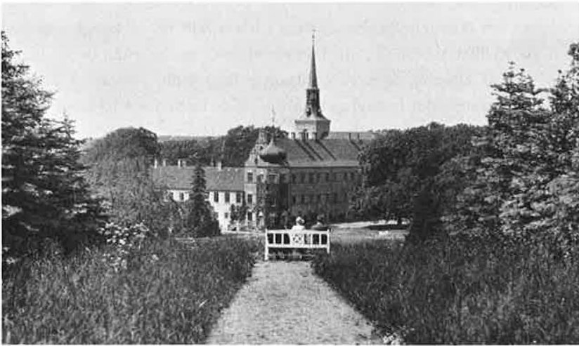
Den i 1620 forhøjede østfløj og lidt af sydfløjen set fra Grønbjerg (udsnit af foto i Brahetrolleborg Folkemindesamling, Gærup).

ket næppe har voldt vanskeligheder. Det var dette tingsvidne, udstedt af otte »dannemænd«, d.v.s. agtede bønder, som kong Hans dernæst bekræftede. Om vidnerne oplyses stereotypt, at de kunne huske 50 år tilbage »og somme ydermere«. Vigtigere – og juridisk afgørende – er det, at brevet blev behørigt tinglyst af den kongelige rettertingskansler uden at møde indsigelser.