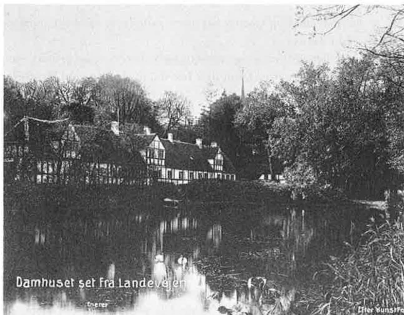
Huse i Brahetrolleborg avlsgård set fra nord. Endnu i vor tid er klosterholmen præget af munkenes karpedamme, der ved sindrig udnyttelse af terrænet står i indbyrdes forbindelse. I den lange længe fandtes i nyere tid godsets smedie (længst til højre), som i dag er godskontor.

Nok er det, at stedet var ideelt til et kloster. Silkeåens løb falder brat, mens det passerer holmen på sin vej ud i engene, og med en dæmning kunne munkene skabe mølledammen, der både skærmede klostret og gjorde nytte. Fra Nørre sø og fra de omliggende højdedrag banede flere bække sig vej og kantede klosterholmen, inden de løb ud i Silkeåen. På alle sider omgaves klostret yderligere af lave, side engdrag, som vor tids veldrænede agerbrug ikke lader vederfares retfærdighed.