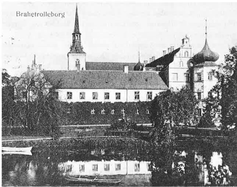
Brahetrolleborg ca. 1890. Engen, der sås på det rantzauske træsnit, er forvandlet til sirlig herregårdshave.

søen, hvis ælde påberåbes i 1498, gik tilbage til kong Valdemars gave. Lidt vest for Høbbet når landevejen Nyborg-Bøjden sit højeste punkt, næsten 100 m. På dette markante sted stod indtil for nyligt fire usædvanligt høje elme, der kunne ses viden om og gav stedet navnet Fire træsbakken-afløsere, formoder vi, af de bøgetræer, der har givet Høbbet navn.