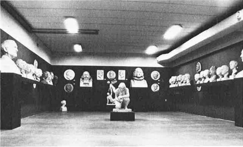
146 gipsmodeller udstillet i Rådhusets kælder. Udstillingen er kun tilgængelig i Rådhusets åbningstider. De to store buster for enden af væggen er t.h. Brorson, t.v. Anders Arrebo. Busterne fylder 2 værelser.