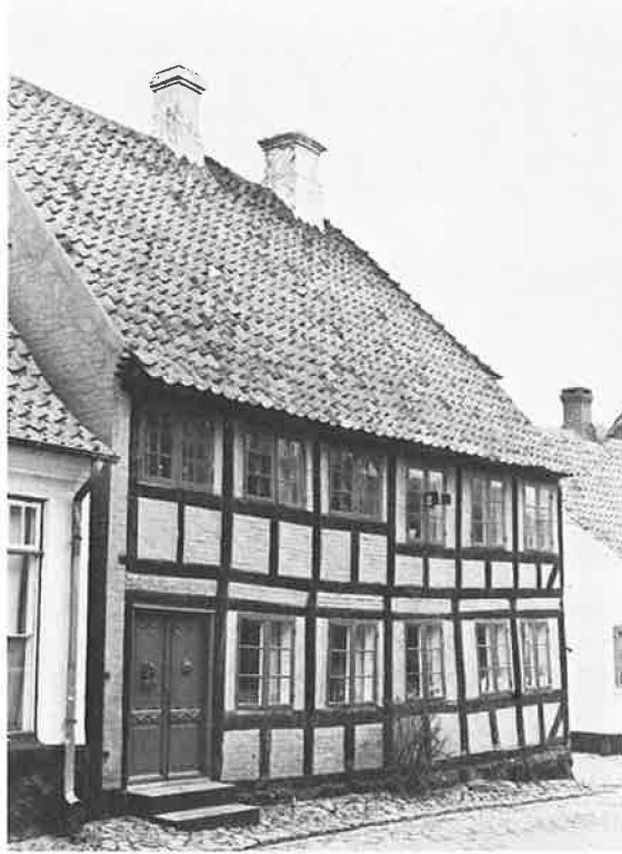
De to sammenbyggede huse fra 1803. Gadedøren er en kopi, dørhammeren er fra Italien.