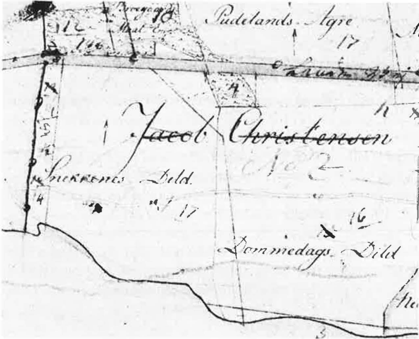
Udsnit ved »Snekkenes Dild« af det ældste matrikelkort (original I), 1:4.000. Markskellet mellem »Drigstrup Svanekeiers Mark« og »Fælleden« ses lige til venstre for »S« i »Snekkenes Dild«. Den gamle, let slyngede vej til Kerteminde ses under ordene »Snekkenes Dild«. Den er vist med to linier (desværre meget tynde) med ca. 1 mm afstand. Den ny Kertemindevej, der har en bredde på 22 alen (= ca. 3 mm), forløber retlinet – med et let knæk, hvor den krydser markskellet.

gede i 1869 på en parcel af matr. nr. 41, Munkebo. Og dette hus har navnet »Krabbested«. – »Snekkeledgård« i den østlige ende af matr. nr. 41 blev først bygget i 1916.