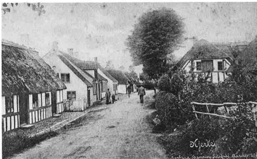
Postkort: Kerte 1905.

bortaccorderet. »Ogsaa skal Sogneforstanderskabet vaage over, at rigtig Omgang iagttages ved Sognekjørsel«.