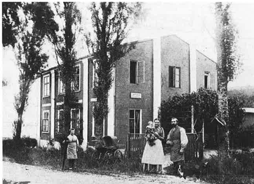
Familien Moritzen fotograferet foran Aldersro ca. 1895.

At Klestrup fortsat driver landbrug, aner man gennem sønnens dagbøger, men hvor megen jord og hvor den er beliggende, oplyses ikke.