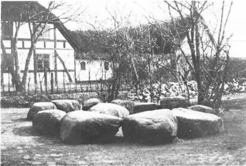
Den velbevarede bystævne i Bårdesø (1914). Det var på bystævnen, bymændene mødtes og drøftede fælles anliggender.