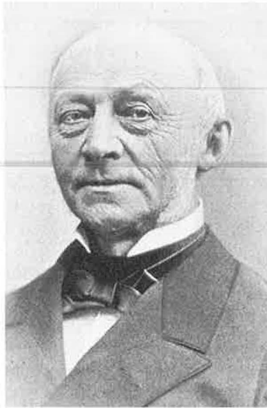
Carl Frederik Tietgen (1829–1901). Billederne stammer formentlig fra 1860'erne og 1890'erne.

denne afhængighed, som flere og flere danske erhvervsfolk prøvede at gøre sig fri af, og som i de kommende år var drivkraften bag mange selskabs- og bankstiftelser. Tietgen kom til at spille en central rolle i en vellykket dansk indsats for at afværge krisen og befæstede dermed yderligere sin position som en af den kommende udviklings foregangsmænd.