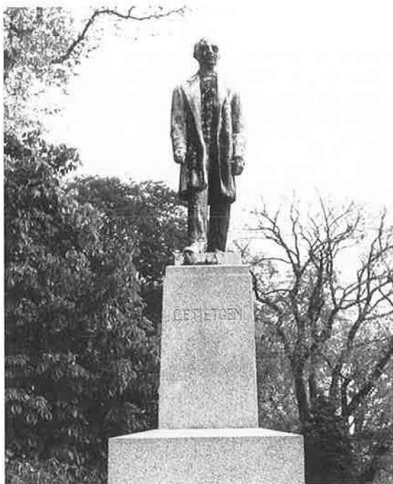
Viggo Jarls statue af C. F. Tietgen, fotograferet mens den endnu stod i Kongens Have ud mod Jernbanegade. Midler til rejsning af mindesmerket indsamledes af »Komité for Erhvervelse af Statue af Geheimeraad Tietgen«, og afsløringen fandt sted den 15. oktober 1908.