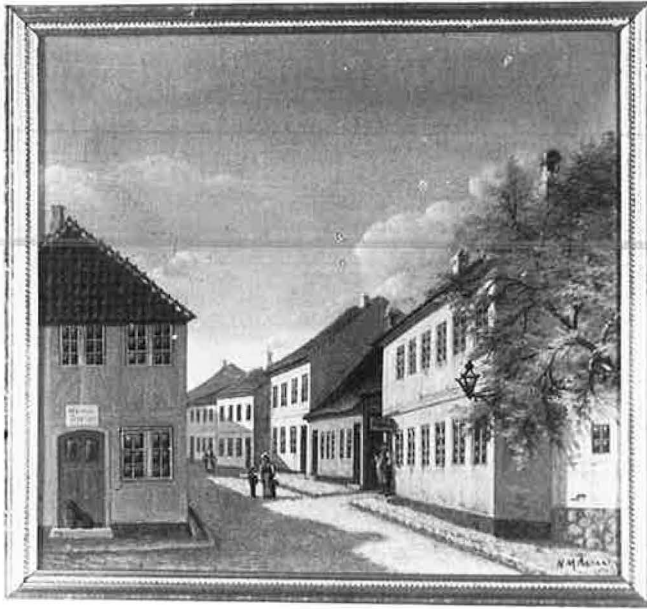
Pogestræde, ca. 1850. (Maleri, Møntergården). Huset til højre (med gadelygte) er Tietgens fødested.

gade. Tietgens mor blev i den anledning sendt til kogeundervisning på Slottet. Udslidt af arbejde og de mange børnefødsler døde hun imidlertid allerede året efter, 1841, da hun var 40 år gammel og C. F. Tietgen var 12.