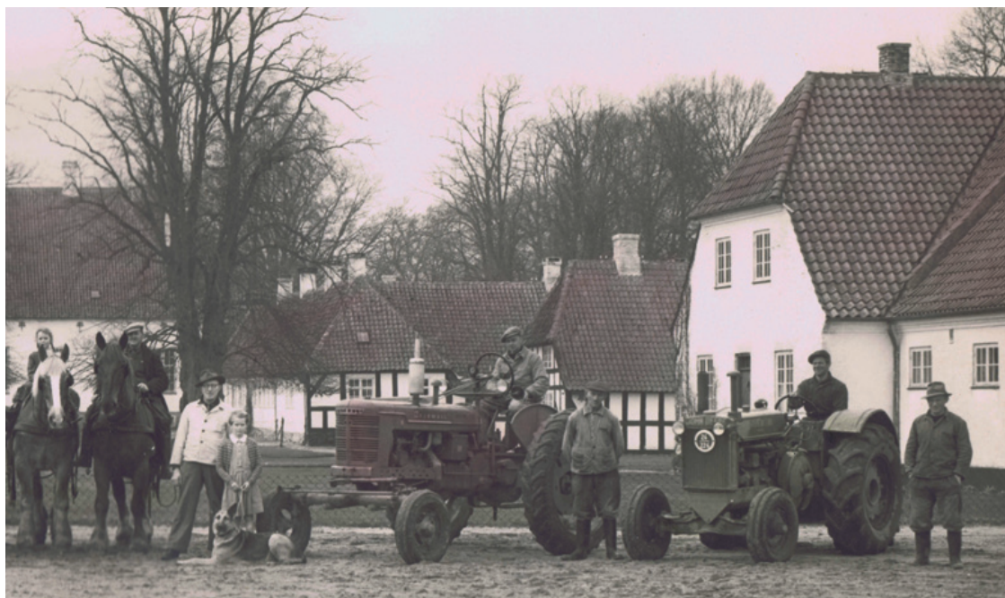
Fire år senere, i 1958, viser et foto af den samme opstilling på det samme sted, at der er forsvundet to spand heste, og maskinparken er forøget med en traktor, så der nu er tre. Forvalteren er stadig i rideudstyr og med hat og stok.