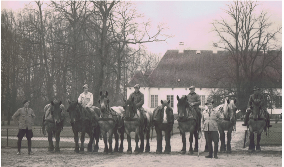
Et foto af Brobygårds folkehold og driftsmidler fra omkring 1954 viser en opstilling, som vi kender den fra andre herregårde. Her er 10 heste = 5 spand trækkraft, to traktorer og forvalteren i ridebukser og ridestøvler, med hat og stok. Stokken skyldes måske et dårligt ben, forårsaget af en motorcykelulykke, men var også et værdigt symbol for en forvalter.