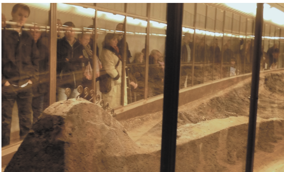
Ladbyskibet får besøg af festdeltagerne i anledning af dets 75-års jubilæum.

til, hvis der dukkede noget mistænkeligt, arkæologisk-lignende op ved markarbejdet. Ved en henvendelse til Helweg Mikkelsen sikrede man sig en hurtig og ordentlig respons og behandling, samtidig med at eventuelle gode fund blev udstillet på museet i Odense. Fremgangsmåden virkede selvforstærkende på den måde, at den kastede nye, lovende fundindberetninger af sig – til glæde for sports-arkæologen.