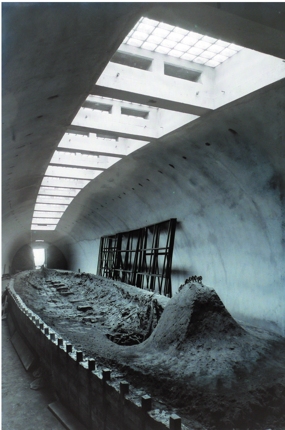
Ladbyskibet i færd med at ændre status fra skjult begravelsesskib til museumsgenstand.