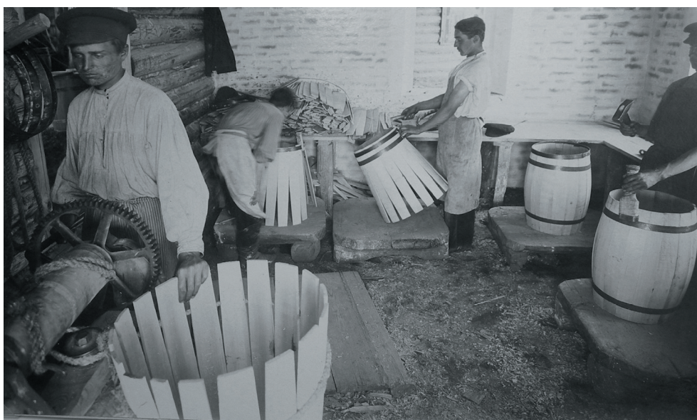
Der samles smørdritler i Sibikos Kurganfilial. Uden årstal, men antagelig omkring 1900.