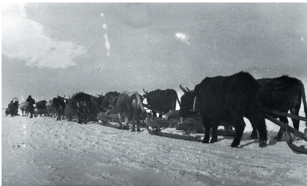
Sibikos varetransport om vinteren. "1000 slæder med vore varer", står der i et notat til billedet. Motiv fra Semipalatinsk, uden årstal.

Sibiko havde da ikke mindre end 40 filialer i Rusland, og de fleste af dem var i Sibirien. Kompagniet havde tilmed bygget sin egen fabrik i Tjumen nord for Kurgan, hvor der blev fremstillet mejeriudstyr.