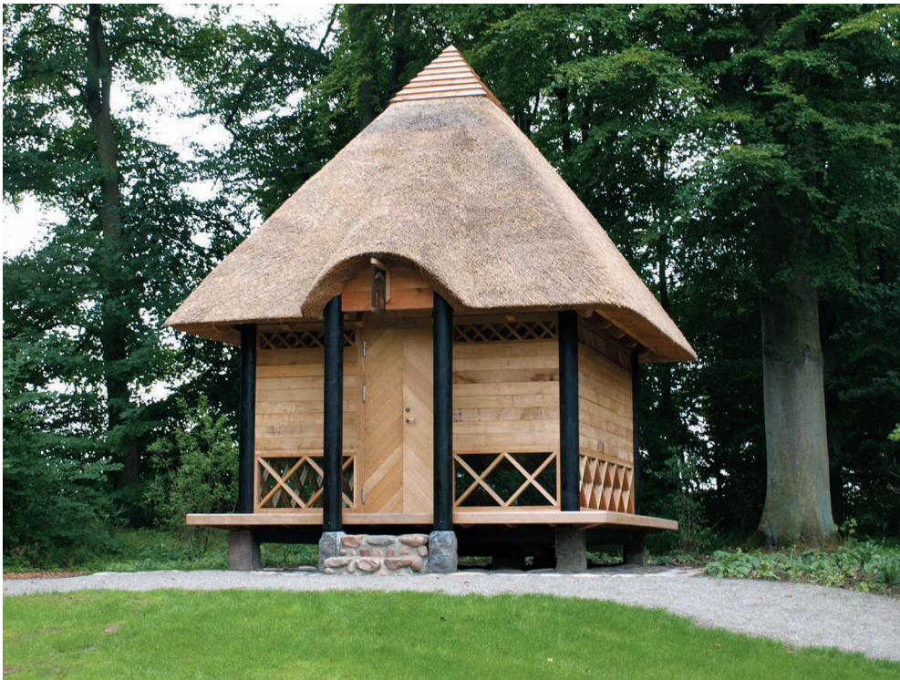
Den nye kildehytte 2010.