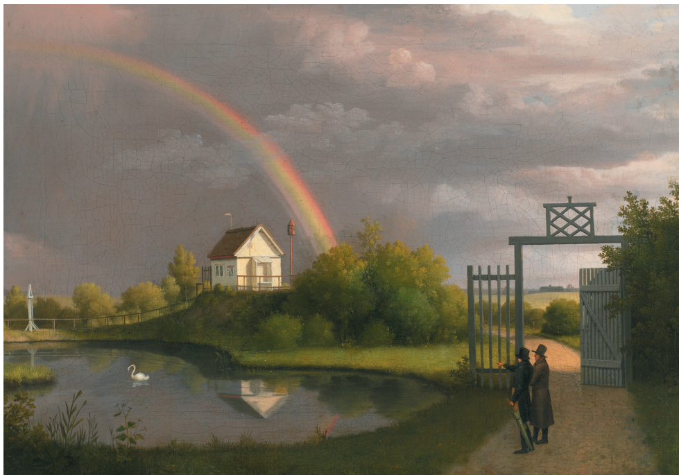
C.W. Eckersberg: Marieshvile i Sanderumgaards Have 1806. Privat eje.

Ingen anden have på Fyn er der dig- tet om og malet i som i Sanderumgaards Have. Nu er haven genåbnet og restaure- ret til glæde og gavn for alle, der vil søge stilhed og skønhed under de skyggefulde træer og ved de svale kanaler.