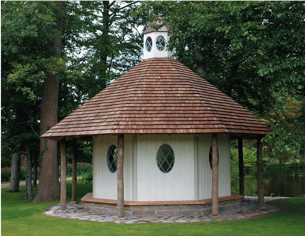
Marieshvile i 2010.