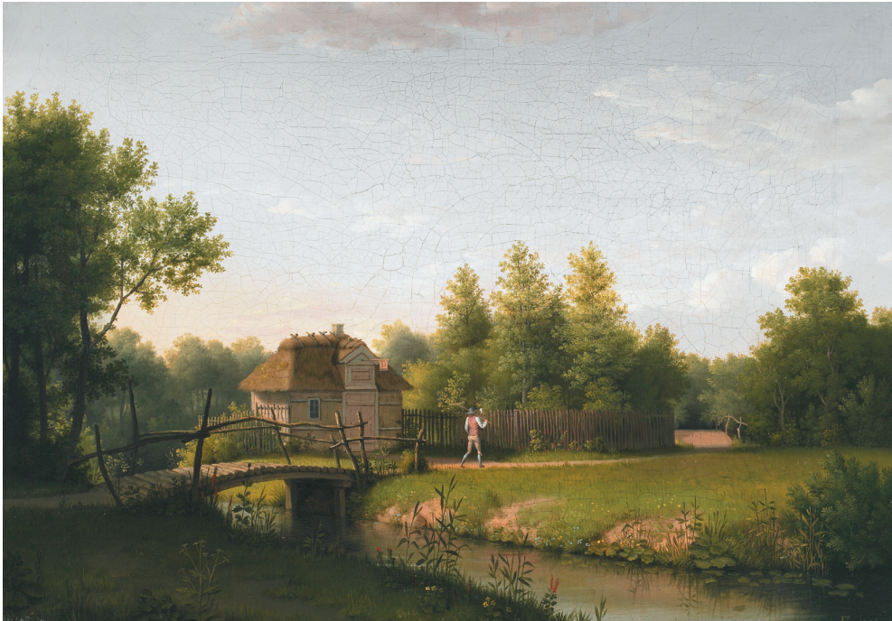
C.W. Eckersberg: Kildehytten i Sanderumgaards Have 1806. Privat eje.