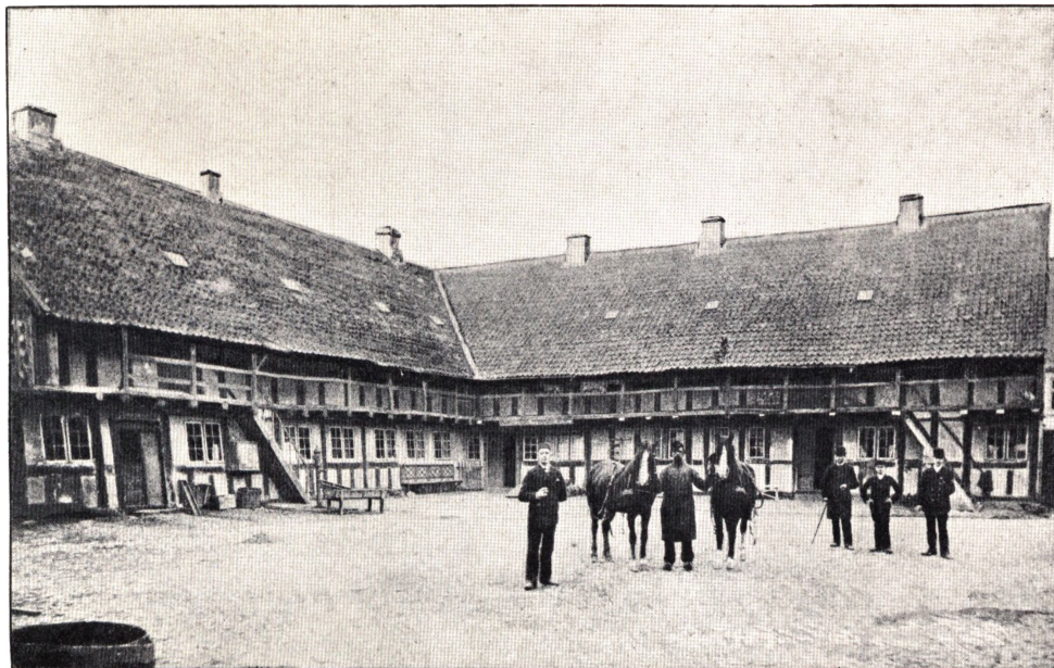
Den gamle Købmandsgaard i Grenaa.