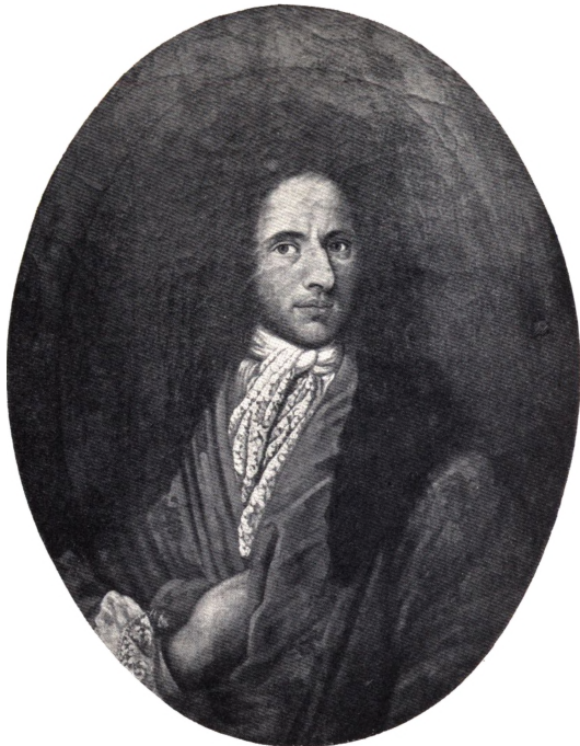
Etatsraad Hans Nobel til Sandholt. (F. 1657 † 1732).