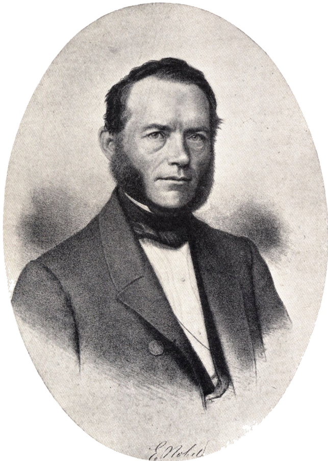
Emilius Ferd. Nobel. (F. 1810 ÷ 1892).