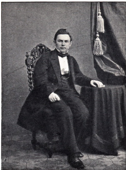
Bendix Christian Nobel. (F. 1825 ÷ 1890).