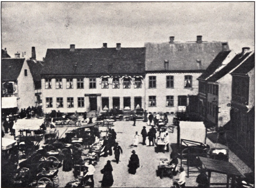
Fabrikken i Nykjøbing F.