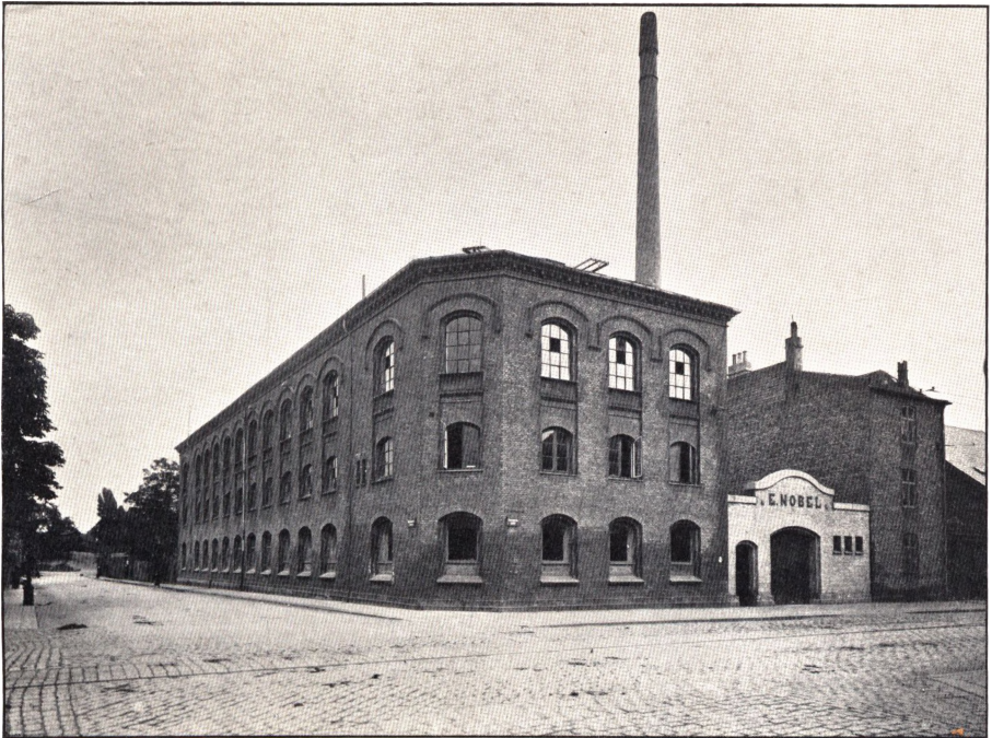
Fabrikken paa Christianshavn.