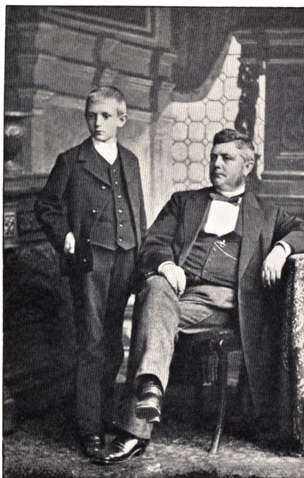
Frederik Carl Emilius Nobel. (F. 1833 ÷ 1888). Og ældste Søn: Ove Kruse Nobel.