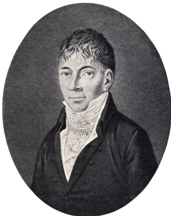
Bendix Christian Nobel. (F. 1773 ÷ 1818).