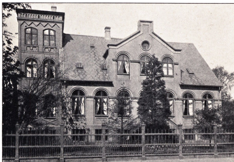
Villaen Nyvej No. 5, paa Frederiksberg.