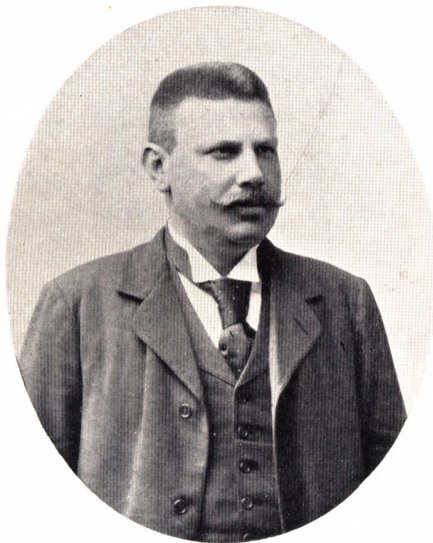
Emil Harald Nobel. (F. 1861 ÷ 1906).