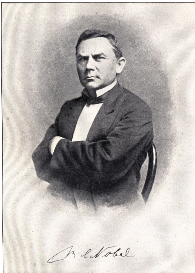
Bendix Christian Nobel. (F. 1825 ÷ 1890).